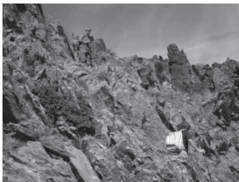
Camí del Carlit.

segueix sent una excursió molt atractiva. Només cal un cert entrenament i prendre-s'ho amb calma. Si ens ho prenem amb calma, la pujada al Carlit es pot fer bé en unes 4 hores. El cap de setmana que s'havien de fer els 75 cims, per una sèrie d'imprevistos familiars, em vaig quedar sol, però això no és massa problema. El camí del Carlit sempre sol estar molt concorregut.