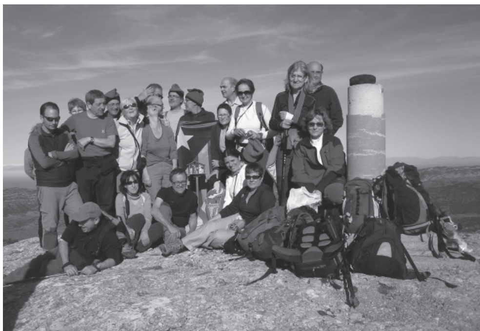
Cim de la Roca Corbatera. Fotografia de Josep Maria Ballart

Tota la penya de la SEAS, que hem anat a col·locar el pessebre a la Roca Corbatera, hem passat per aquí. Contens, xirois i valents de viure i gaudir aquest parell de dies de convivència força ben aprofitats.