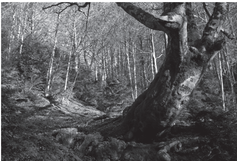
Premi foto d'excursions de la SEAS: «Gegant» de Jordi Gironès