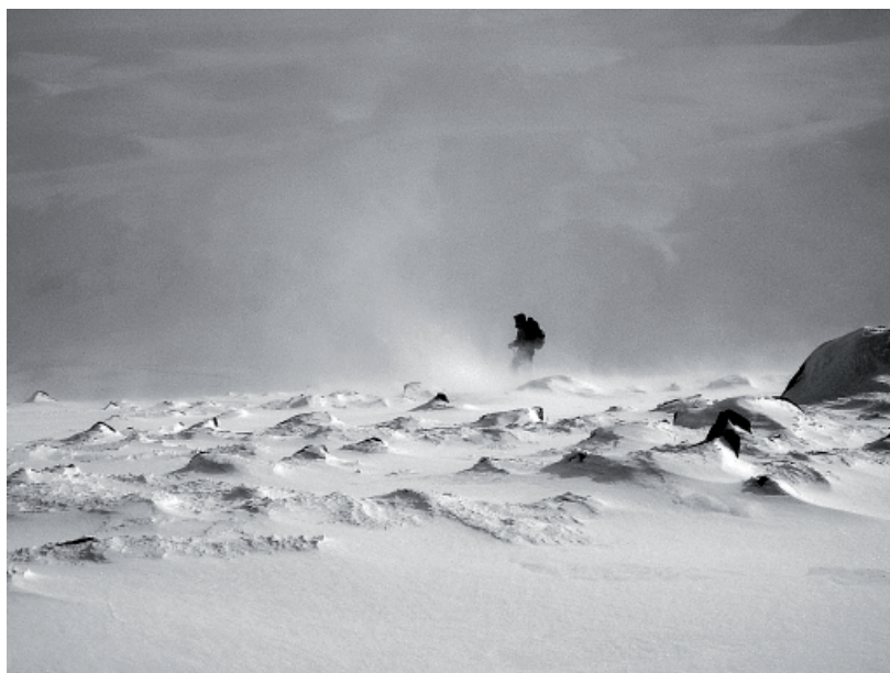
Una de les fotos de la millor col·lecció: «Hivern» de Per Kvam