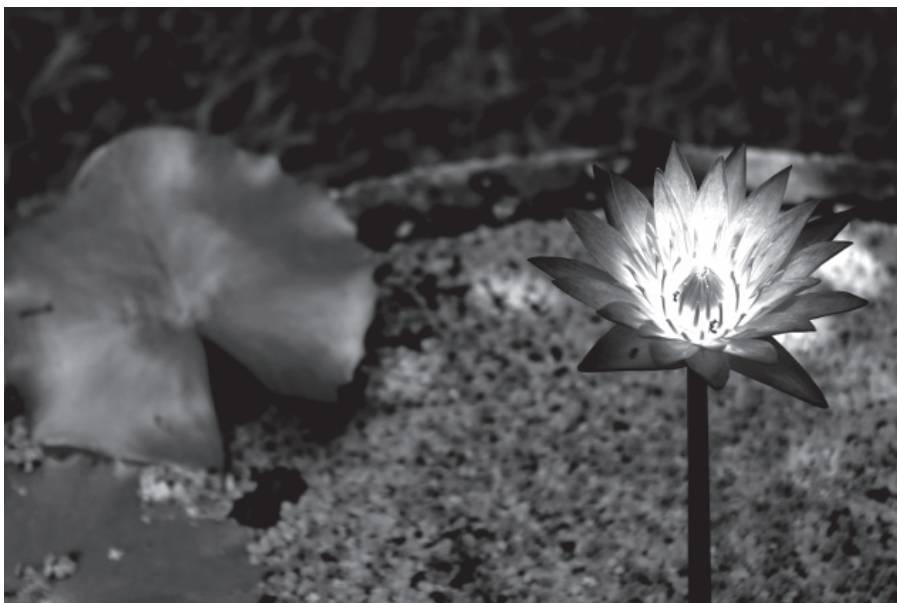
Segon premi: «Espelma florida» de Lluç Canals