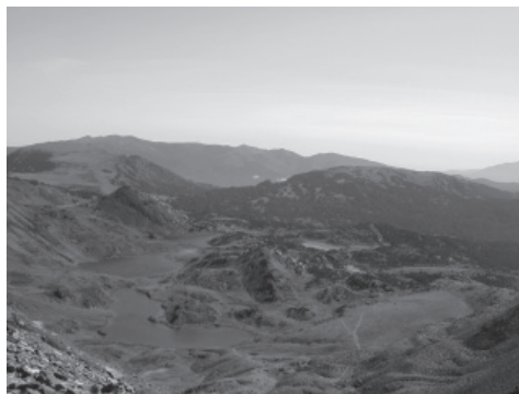
Estanys Sobirà, Trebens, Castellar i de les Dugues. Foto de Lluís Solé Sugrañes.

Val a dir, que potser el Carlit no te rés més d'extraordinari que els altres cims que sobrepassen lleugerament els 2.900 m i que envolten la Cerdanya, com el Puigmal, el Puigpedrós, la Tossa Plana de Lles i alguns altres de menys coneguts. Potser l'única diferència és que no és tan arrodonit com els altres i que els últims 150 m requereixen una entretinguda grimpada. Però, per mi es va convertir en especial des de la primera vegada. Era el primer cim d'una certa entitat que feia sense l'acompanyament de la família o dels caps escoltes de l'agrupament, i això el va convertir en una fita important en la meva història personal amb la muntanya.