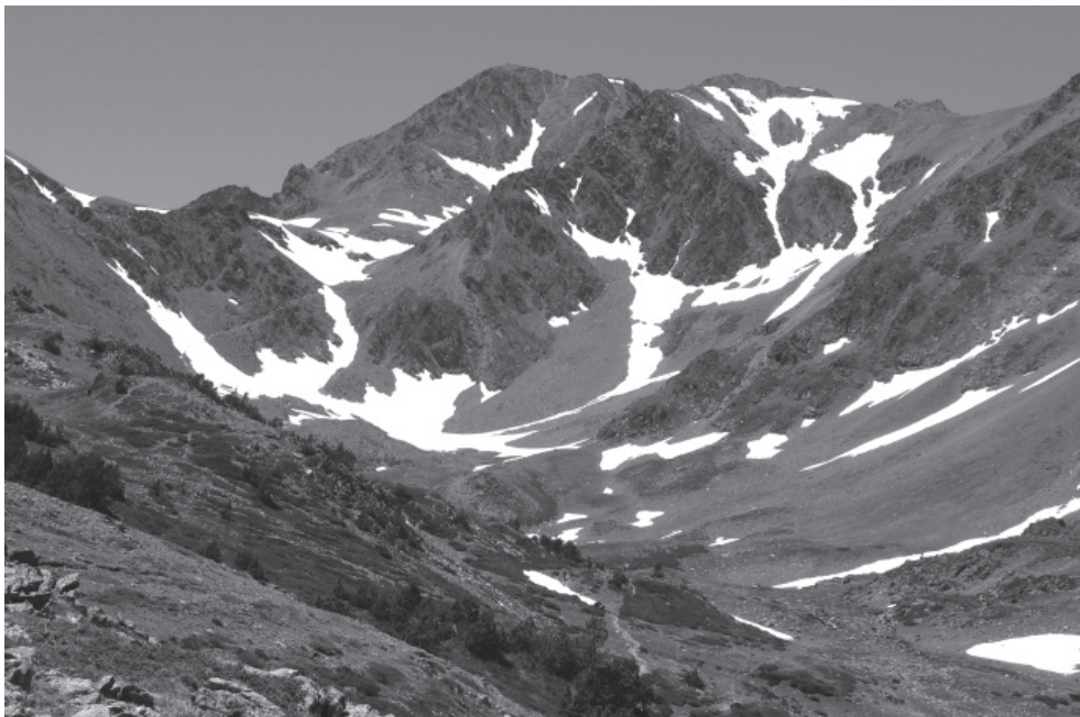
El Carlit des de l'estany de Trebens.

sens fi d'estanys i estanyols, i cap a Mont-lluís.