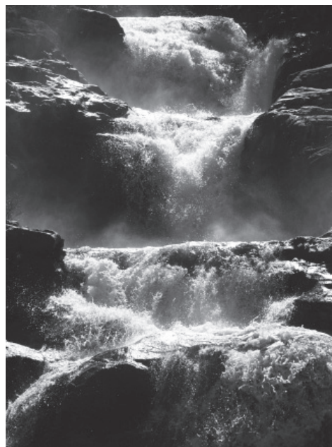
Millor fotografia per votació popular: «Força» de Francesc Riera