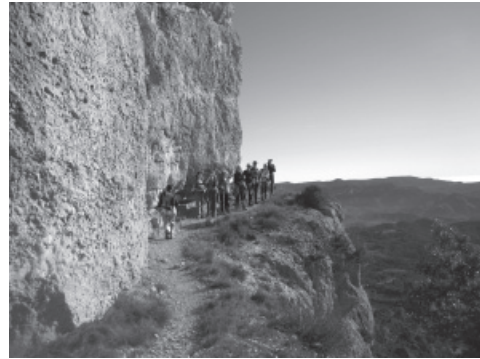
Camí del grau de l'Agnet.

Per protegir el difícil equilibri entre l'activitat humana i els ecosistemes, l'any 2002, el Parlament de