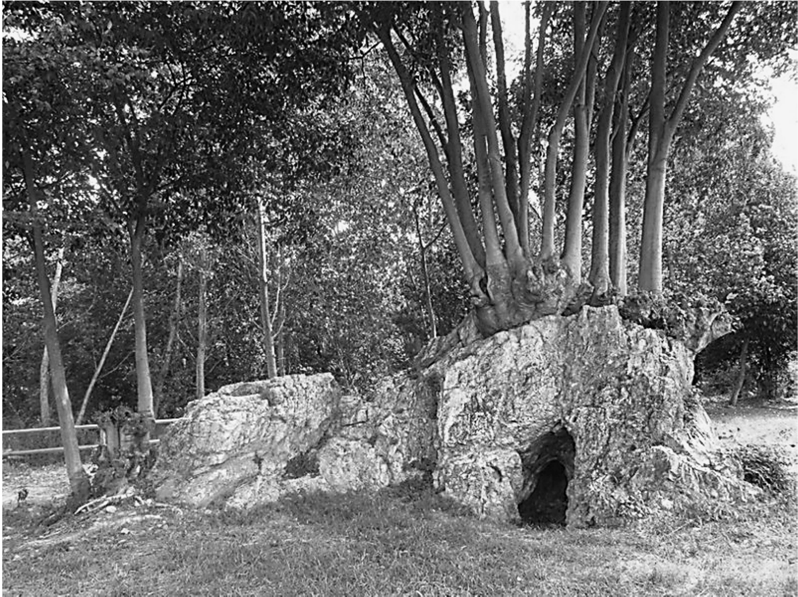
El drac de Sant Celoni