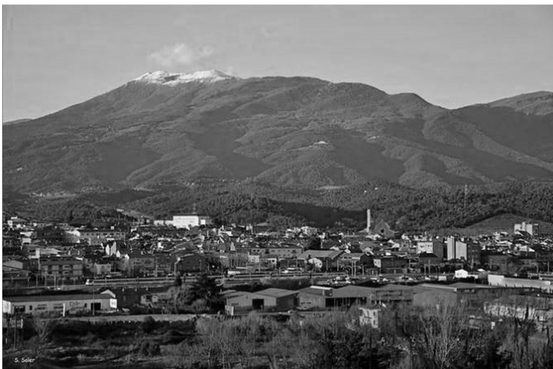
Sant Celoni, amb el Montseny al fons

La ciutat de Sant Celoni rep el nom de la capella que es va construir cap al segle XI al peu del camí ral. Sant Celoni és la traducció del llatí Sanctum Celedonium i Sancti Celedonii . A través dels segles el nom ha tingut moltes grafies: Sancti Celidonia, Sant Celdonij, Sant Celdoni, Sent Salony, Sanseloni, Sant Celoni.