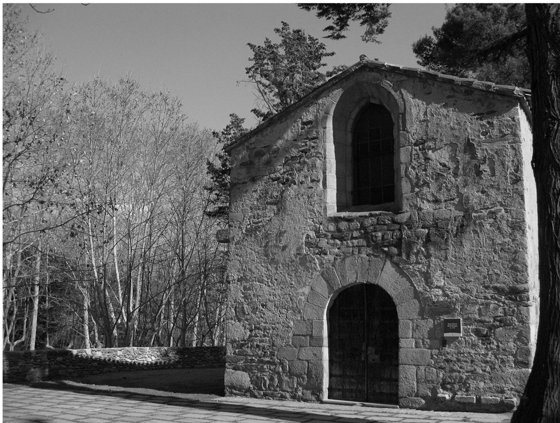
Sant Martí de Pertegàs

de planta rectangular, gairebé quadrada, estructurada a l'entorn d'un pati central. Les galeries d'arcs conopials de maó del segon pis corresponen al segle XVI. Al primer pis del pati destaca un gran finestral tripartit amb esveltes columnes gòtiques. Actualment és la seu de diversos serveis municipals, i la planta baixa s'utilitza com a sala d'exposicions.