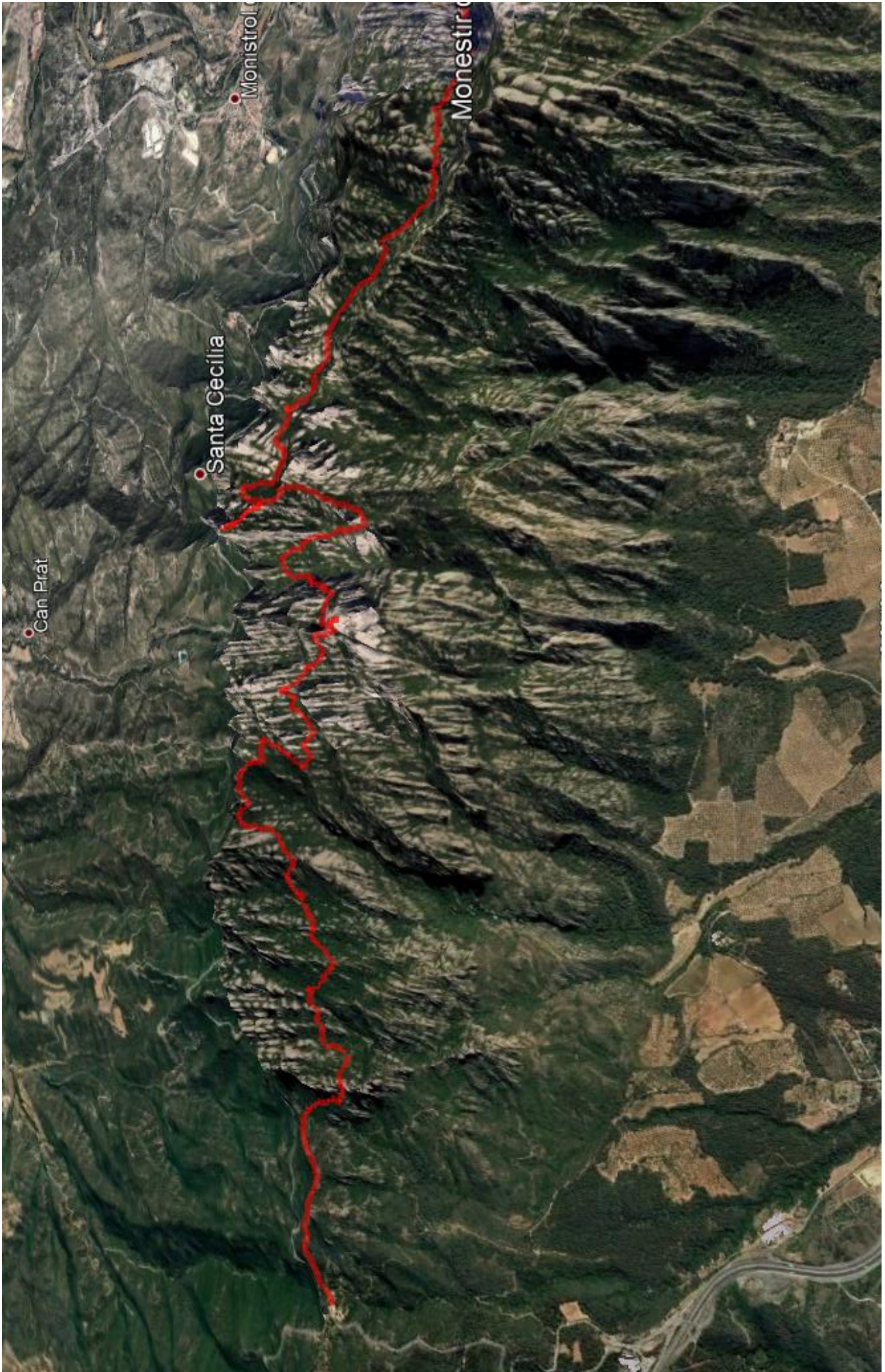
Travessa de Montserrat - 26 de gener de 2019 - Grup de Joves de l'AE Talaia