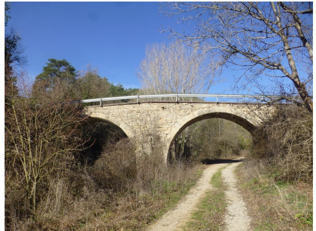
El Pont de Roma

Seguint aquesta pista baixarem cap als prats que envolten la Tor de l'Espà, una gran masia documentada des de l'any 905. Propera a la masia, amagada al mig del bosc, hi ha la capella de Sant Quirze. En aquest punt deixarem el Camí Ramader de Ponent que segueix vers Prats de Lluçanès per anar cap a Santa Eulàlia de Puig-oriol on enllaçarem amb el Camí Ramader Central.