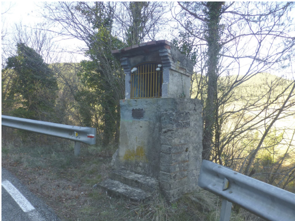
Pedró de l'Àngel de la Guarda

El diumenge 17 de març és previst fer la setena etapa del Camí Ramader de Marina. La començarem al Co-bert de Puigercós, on esmorzarem, i a partir d'allà, baixant pel costat de la riera de Merlès arribarem al Pont de Roma on deixarem la riera per enfilarnos per un corriol cap a la pista que ens portarà a la Bassa dels Bous.