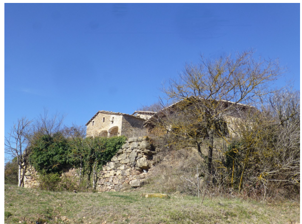
La Tor de l'Espà

Aquesta etapa és relativament curta però això ens permetrà que en acabar-la puguem visitar el Centre d'Estudis i Recursos de la Transhumància de Lluçà.