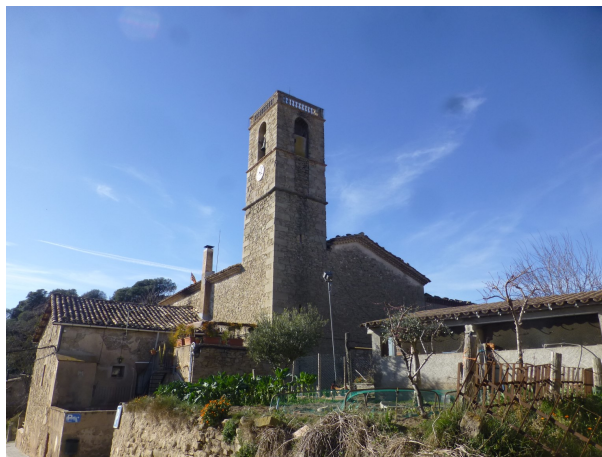
Església de Santa Eulàlia de Puig-oriol

Per si algú no vol venir al dinar comunitari que sàpiga que a Olost hi ha d'altres restaurants; davant mateix del Cafè Esport hi ha la Fonda Sala.