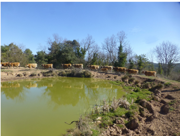
Les vaques de la Tor de l'Espà

Més endavant, després de travessar el rec de Bartrons i la riera de Lluçanès, pujarem cap als prats del Mallol i el Quintà de la Coma on trobarem el GR-1 que ens acompanyarà fins a Santa Eulàlia de Puig-oriol punt final del recorregut.