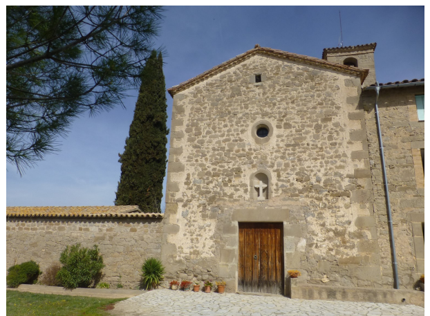
La Santa Creu de Jutglar