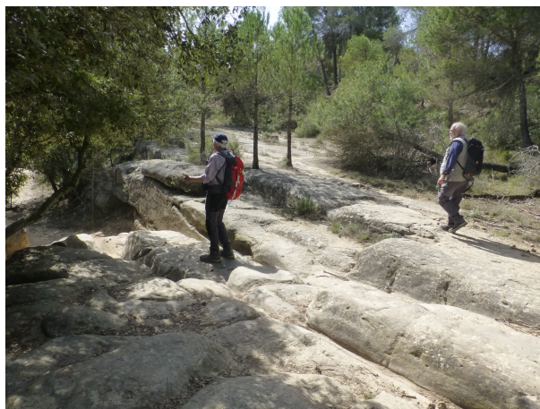
Pel senderol ple de rocam

Segueix per entremig d'un bonic bosc d'alzines i baixa cap al collet de la Cirera per un tram amb moltes roques i grauets. Més endavant, passa prop de la pleta de Salelles i per un senderol, encara ple de rocam, arriba a cal Vinyes.