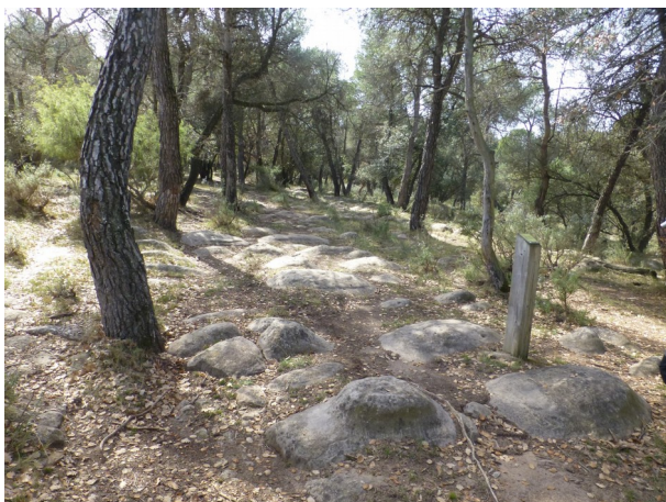
La Ramada Encantada al pla Moixó

Després de travessar la riera de Lluçanès remunta cap al coll de l'Arç i, vorejant el serrat de la Guineu, arriba al pla Moixó on hi ha la Ramada Encantada; tot un ramat transformat en roques per una malifeta del seu pastor.