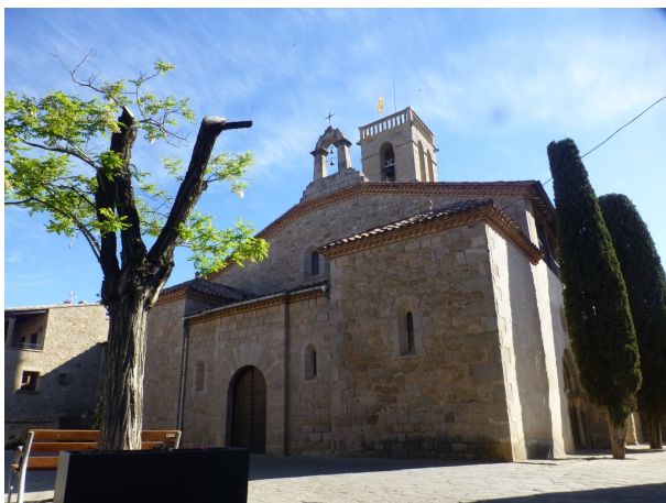
Església de Sant Feliu Sasserra

Esmorzarem al restaurant Perot de Sant Feliu Sasserra, on vàrem dinar la passada sortida, i allà començarem el recorregut. Abans de sortir del poble pujarem a la plaça on hi ha l'església de Sant Feliu on veurem un monument que recorda que la vila fou cremada per les tropes del rei Felip V el febrer del 1714.