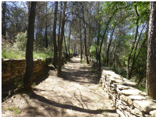
El Camí Ramader recuperat al Pla de l'Oliva