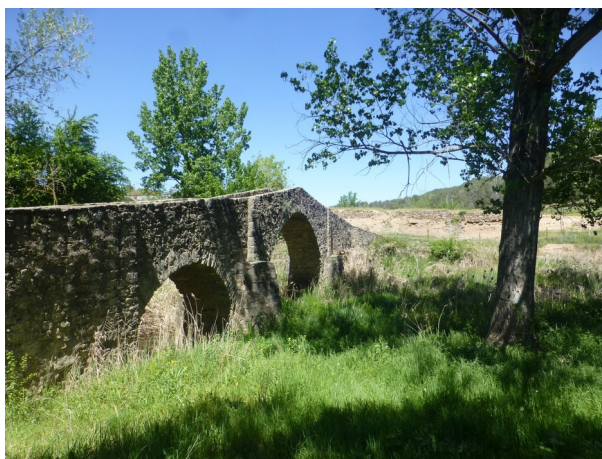
El Pont Vell sobre la riera de Relat

Just acabat aquest tram podrem visitar una altra relíquia històrica: la Torre dels Soldats; una antiga torre del sistema de telegrafia òptica. I abans d'arribar a Avinyó travessarem la riera de Relat pel Pont Vell, construït el segle XIV però amb un possible origen a l'època romana.