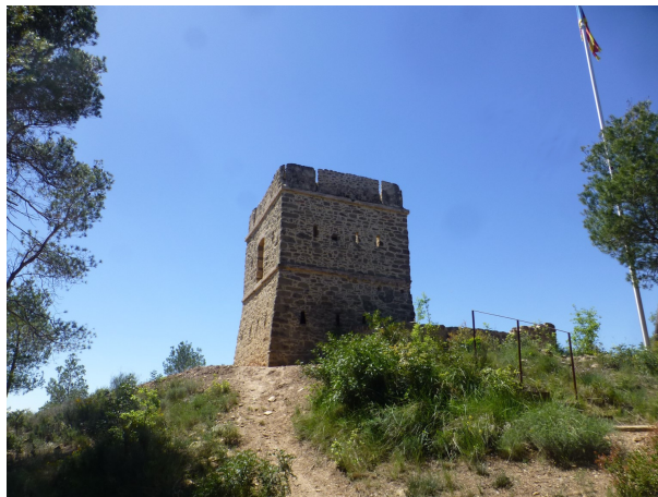
La Torre dels Soldats

Just acabat aquest tram podrem visitar una altra relíquia històrica: la Torre dels Soldats; una antiga torre del sistema de telegrafia òptica. I abans d'arribar a Avinyó travessarem la riera de Relat pel Pont Vell, construït el segle XIV però amb un possible origen a l'època romana.