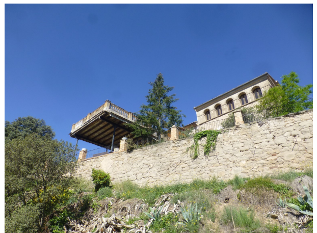
Masia el Pilar

Tot seguit anirem cap al barri del Carrer de Gafarró on retrobarem el Camí Ramader el qual seguirem per travessar el pla de Moixons ple de masies disperses. Més enllà de cal Pelegrí enllaçarem amb la carretera B-431 que va cap a Avinyó. Seguint la carretera vorejarem el nucli de masies del Carrer de la Mongia i el gran casalot del Pilar, enlairat per damunt de la carretera, on hi ha la creu de terme i la capella del Pilar.