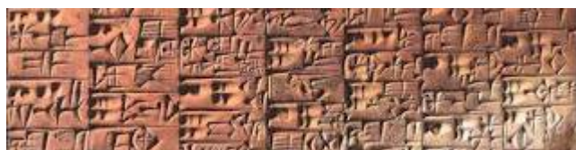
Tauleta de fang amb