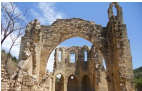
Santa Maria de Vallsanta