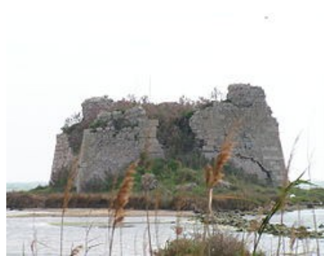
Torre dels Alfacs

Tres dies d'arqueologia subaquàtica, combinada amb l'excavació d'una preciosa torre militar endinsada al mar... i de descobriments històrics sorprenents.