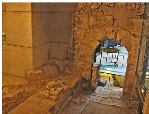
Termes porta de mar