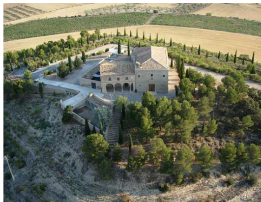
Santuari de La Bovera