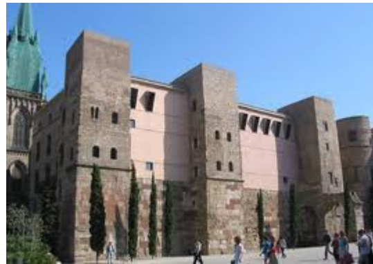
Torres romanes de Barcino

llegat i, en definitiva, apropar-lo als barcelonins d'avui és l'ambiciós propòsit del Pla Barcino, promogut per l'Ajuntament, que es va presentar el dimarts 19 de juny a Barcelona. Segons el tinent d'alcalde de Cultura, Coneixement, Creativitat i Innovació, Jaume Ciurana, es tracta d'un pla a mitjà i llarg termini en què s'invertiran 2,15 milions d'euros, que serviran per promoure projectes de recerca i documentació, museïtzació i excavacions. Entre les actuacions previstes hi ha la millora del coneixement de la muralla romana, l'acceleració de la museïtzació de diverses domus o cases de personatges d'elit de la Barcelona romana que es conserven, integrar millor les restes de l'aqüeducte i fer un estudi de les termes romanes. A nivell arqueològic, la iniciativa més destacada és, sens dubte, la recerca i l'excavació del fòrum, que totes les hipòtesis situen, almenys una gran part, sota el que avui és la plaça de Sant Jaume. Per fer realitat això, l'Ajuntament treballa amb la possibilitat de fer prospeccions amb georadar per determinar les estructures existents, per passar després a fer sondeigs arqueològics i estudis dels materials trobats. A més, es continuaran els treballs d'excavació a la vil·la descoberta durant la construcció de l'estació de tren de la Sagrera i a l'església de Sant Just i Pastor.