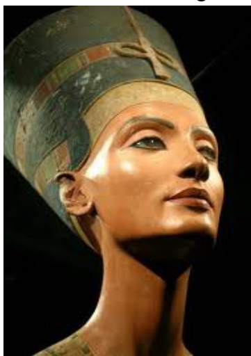
Bust de la reina Nefertiti

Els arqueòlegs alemanys es varen afanyar i el 1911 varen excavar un gran perímetre. A mesura que avançaven, una cosa es feia evident: la ciutat que estaven exhumant apareixia tal com havia estat tres-mil anys abans, cap reconstrucció havia modificat l'aspecte de l'antiga residència reial.