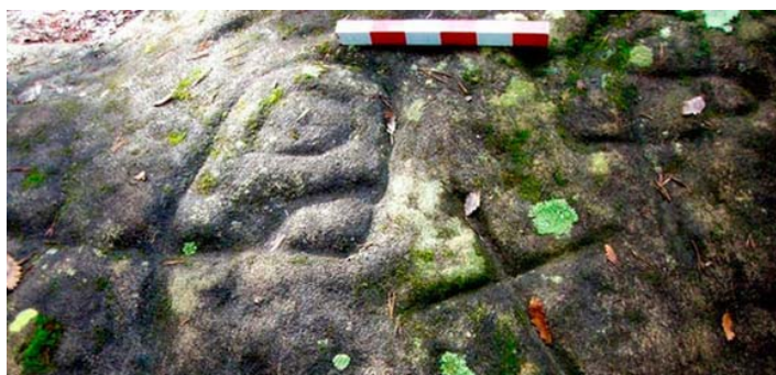
Uns dels gravats del Pla de Savassona

El Pla de Savassona, que és de propietat privada, presenta diversos jaciments arqueològics, amb elements que van des del Neolític fins a l'època ibèrica, i també s'hi troben restes medievals. Es desconeix la datació d'aquests senyals però, segons els estudis, poden datar-se entre l'època del Bronze i l'edat mitjana.