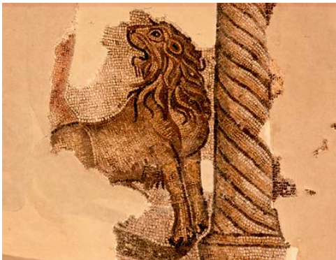
Restes de mosaic de Centelles