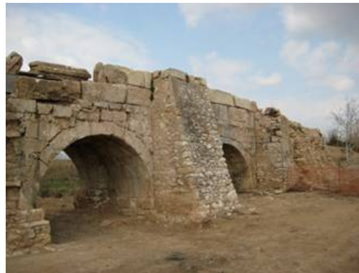
Pont de les Caixes