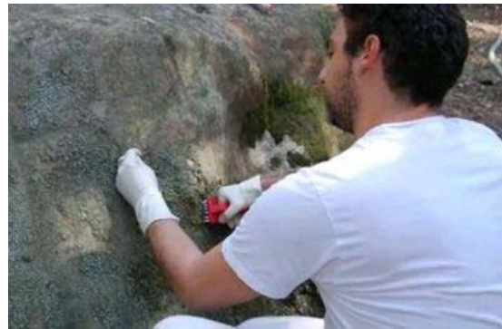
Arqueòlegs netejant les pedres gravades

L'equip d'arqueòlegs està netejant els líquens i altra vegetació que pot afectar els gravats –alguns fets per percussió, altres per abrasió– i fent una tasca preventiva i de consolidació perquè les restes no es vegin deteriorades amb el pas del temps, l'alta pluviometria i l'espessa vegetació.