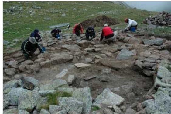
La cabana de Coma de Vaca dalt d'un promontori a uns 2.500 metres