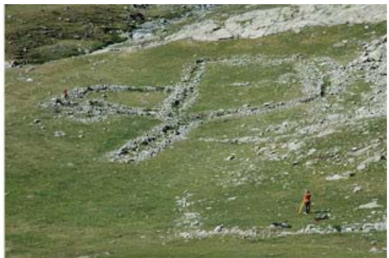
Tancat neolític per al bestiar a la vall de Núria