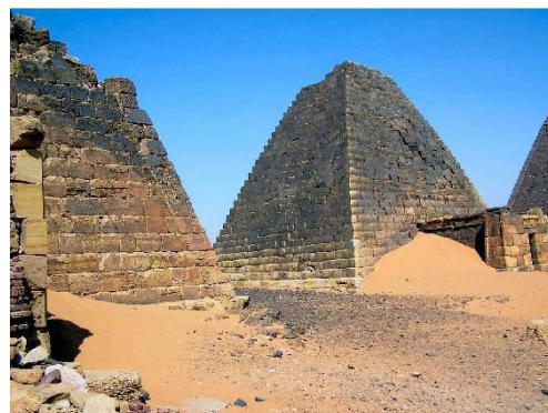
Piràmide de Meroe

A prop de 360 quilòmetres al nord de Jartum, al Sudàn, a tocar del Nil i a l'indret conegut com Hosh el-Geruf, és on hi varen trobar 55 pedres de moldre de gneis. Aquestes pedres s'utilitzaven per matxucar minerals i recuperar així el preciós metall.