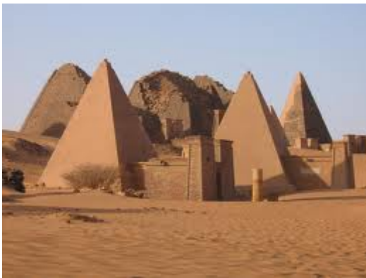
Piràmides de Meroe

L'equip va excavar també un fossar on hi varen trobar objectes que suggereixen que la regió havia estat part del regne de Kush, que podria haver dominat una àrea molt més gran del que es creia, amb una extensió de 1.200 km. de llarg.