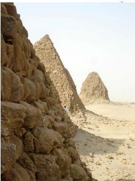
Representació romàntica de les piràmides de Meroe de 1950 a partir dels informes de l'expedició de Lepsius.