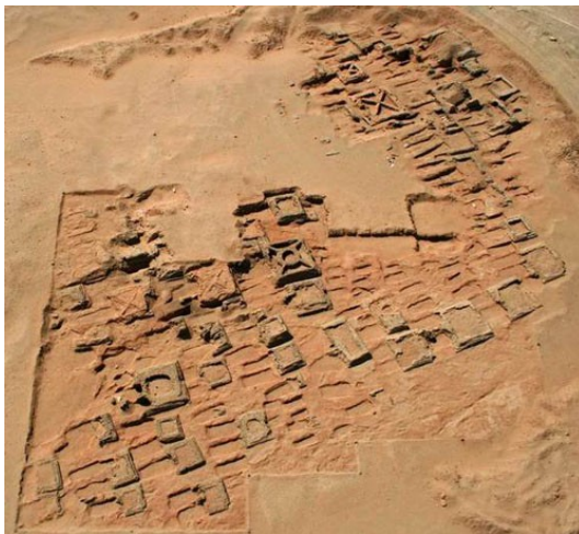
Vista aèria de la necròpolis

La construcció de piràmides va continuar fins que finalment, es varen quedar sense espai per a construir-ne més “Arribaren a un punt en el que estava tot tant ple de tombes que varen haver de reutilitzar les més antigues” .