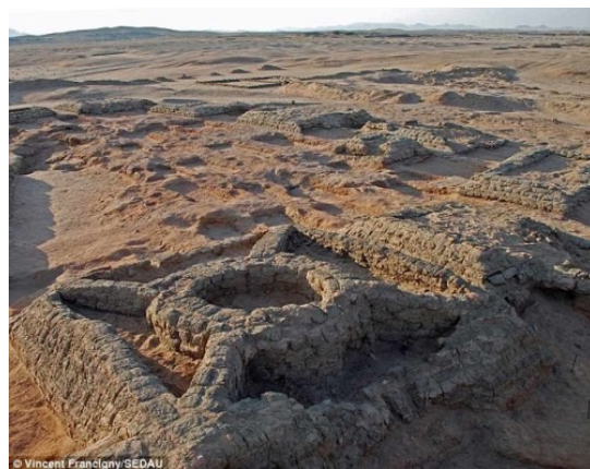
Detall d'una piràmide

Entre els descobriments hi havia diverses piràmides dissenyades amb una cúpula interior (estructura circular) connectada amb els angles de la base mitjançant uns murs. És un misteri perquè la gent de Sedeinga havia adoptat aquest disseny doncs “no afegeix ni solidesa ni l'aspecte extern del monument” . Però Francigny apunta que podria ser una combinació de la tradició local d'enterrament en túmul al que se li va afegir la piràmide, resultant així piràmides amb cercle interior.