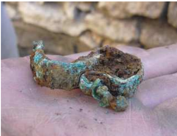
La fíbula trobada a Els Vilars

El jaciment iber dels Vilars, a Arbeca (les Garrigues), és un pou de sorpreses i mai més ben dit. Després d'un any de sequera (o potser de retallades?), han tornat les excavacions a aquesta fortalesa excepcional de més de 2.800 anys d'antiguitat. La nova remesa de fons ha permès excavar al pou-cisterna, situat al mig de la fortalesa. I entre terra i fang, els arqueòlegs i experts del Grup d'Investigació Prehistòrica (GIP) de la Universitat de Lleida (UdL) no paren de trobar restes de gran valor històric per conèixer qui hi vivia i com hi vivia.