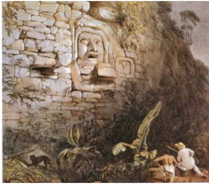
Cap d'Itzam Na a Izamal