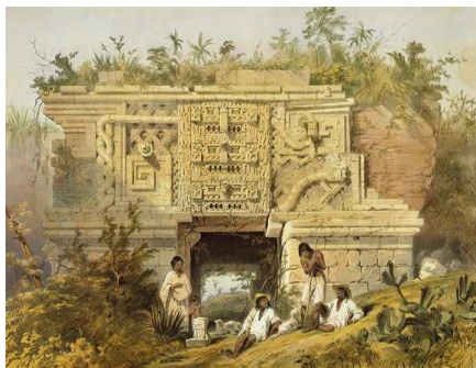
Palau de les Monges/Uxmal-Mèxic