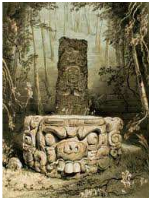
Ídol i altar/Hondures

Catherwood no veia els monuments com a vestigis d'altres cultures sinó com a visions noves. Però així com els seus dibuixos manifesten una precisió profunda, també revelen moments d'omissió o subjectivitat, degut segurament a la dificultat de treballar en situacions difícils, per després reconstruir els dibuixos de memòria. Aquestes contradiccions, malgrat tot, fan la seva obra encara més fascinant.