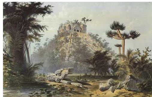
Piràmide a Kukulcan