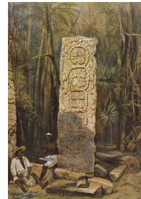
Ídol, cara posterior