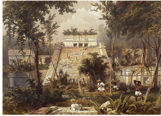
El Castell a Tulum

Catherwood no veia els monuments com a vestigis d'altres cultures sinó com a visions noves. Però així com els seus dibuixos manifesten una precisió profunda, també revelen moments d'omissió o subjectivitat, degut segurament a la dificultat de treballar en situacions difícils, per després reconstruir els dibuixos de memòria. Aquestes contradiccions, malgrat tot, fan la seva obra encara més fascinant.