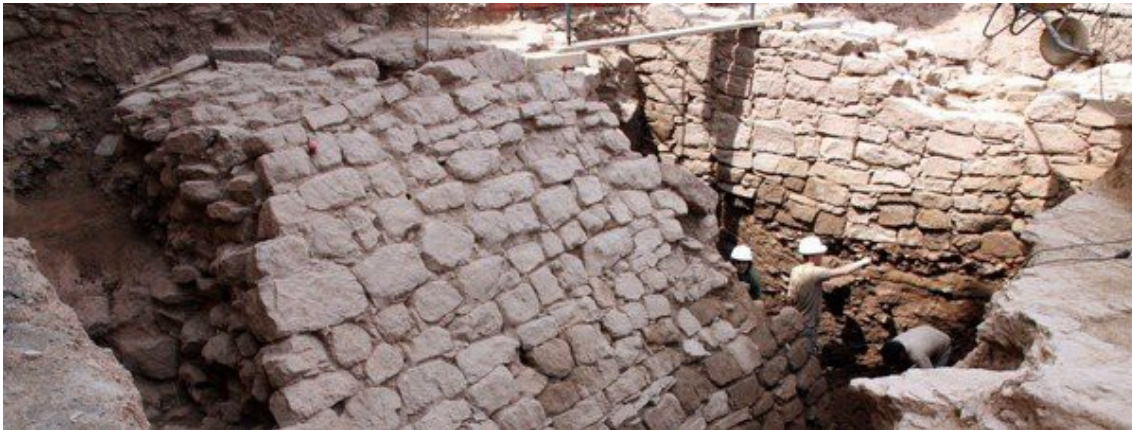
Restes de la muralla descoberta a Prats de Rei

L'excavació es va iniciar com a conseqüència del descobriment d'una muralla i un fossat que daten del S.VI-VII a.C. tal com ja vàrem donar a conèixer en el suplement del nostre full informatiu núm.26. Això, ha manifestat Salazar, ha permès demostrar que “l'oppidum ibèric de Els Prats del Rei era un centre rector del territori molt important en relació a la Catalunya interior” . A més, s'hi ha trobat un conjunt de ceràmica grega de primera qualitat.