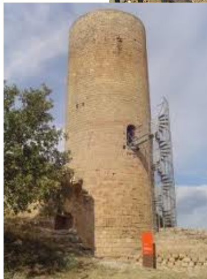
Torre de la Manresana