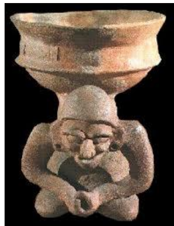
Representació de Huehuetotl el déu vell del foc

D'aquesta manera és com el món assisteix impassible a la destrucció d'un monument que probablement sigui milers d'anys més antic del que declara la "història oficial", un record d'una altra humanitat que s'està destruint poc a poc, envoltat per un nombre cada vegada més gran de centres comercials, vials, polígons industrials i habitatges.