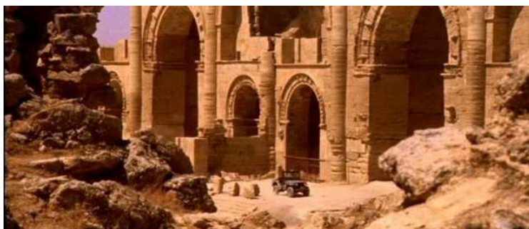
Ruïnes mil·lenàries de Hatra

La ciutat de Hatra, fundada fa més de 2.000 anys al nord de l'actual Iraq i declarada Patrimoni de la Humanitat per la Unesco, ha estat objecte de la barbàrie dels militants d'EI. "La lentitud del suport internacional a l'Iraq ha encoratjat els terroristes ha perpetrar un altre crim" , va lamentar el ministeri, que va tornar a demanar urgentment una reunió del Consell de Seguretat de les Nacions Unides.