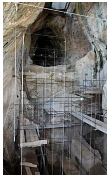
Cova de l'Aragó

Talteüll, doncs, es referma com el jaciment més antic del territori català i passa a ser un dels llocs de referència a escala europea, darrere d'Atapuerca i Mauer. A banda d'un centenar llarg de restes d'homínids, també s'hi han trobat milers d'animals i eines de diverses èpoques.