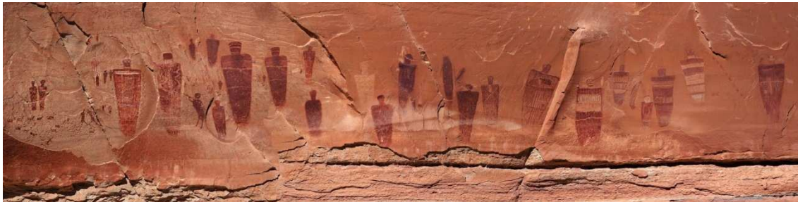
Gran mural de la Roca Roja

Mitjançant una nova tècnica de datació per luminescència, investigadors de la Universitat d'Utah van descobrir que algunes pintures rupestres del “Cañón de la Herradura” foren realitzades mil anys més tard del que es pensava.