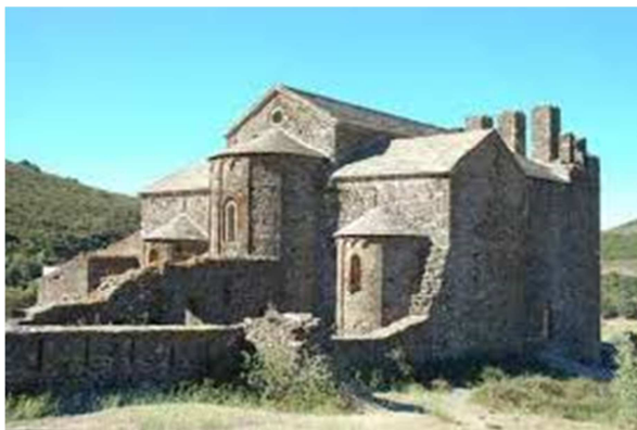
Monestir de Sant Quirze de Colera

El nostre primer objectiu va ser el monestir benedictí de Sant Quirze de Colera , del que ja se'n tenia notícia abans del l'any 815. Les seves pedres ennegrides deixen constància de la seva antiguitat. Situat en una lluminosa vall i envoltat de muntanyes, encara avui ens permet captar la pau i el silenci que predisposava a l'espiritualitat i al recolliment.