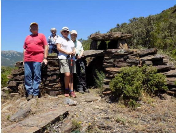
Membres del Grup en el dolmen de Comes Llobes

camí que puja fins al dolmen de les Comes Llobes de Pils , un sepulcre de corredor, amb el passadís fet amb pedra seca.