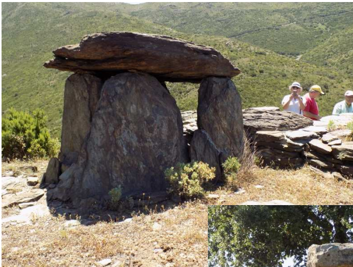
Dolmen de Comes Llobes de Pils

En haver dinat, i quan el sol ja no picava tant encara vam tenir ganes de visitar el dolmen de Cabana Arqueta , un dolmen magnífic i força assequible. La seva visita no estava prevista en el programa però va servir per suplir el menhir que sí, teníem previst visitar i que ens vam saltar, sinó que a més va servir per arrodonir i tancar de manera solemne aquesta sortida de descoberta de final de temporada.