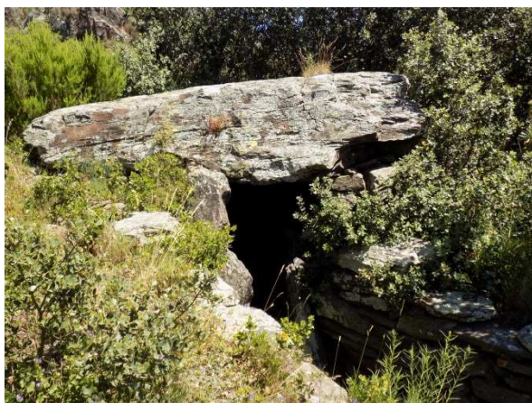
Dolmen del Solà d'en Gibert

A mesura que ens enfilàvem per la serra d'en Gibert s'anava aixecant també el muntanyam que ens envoltava, destacant a la nostra dreta la muntanya dels Pils i la serra de Baussitges que ens acompanyarien fins al nostre segon objectiu, el dolmen del Solà d'en Gibert .