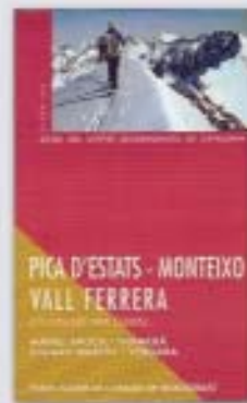
Pica d'Estats - Monteixo - vall Ferrera (Excursions amb esquís)

L'àmbit d'aquesta guia comprèn les capçaleres de les valls dels rius Ter i Freser, amb la incorporació de totes les valls properes del vessant meridional d'aquest tram del Pirineu oriental. Tot aquest territori, que queda a cavall entre l'estat francès i l'espanyol, comprèn les comarques del Conflent, el Vallespir, el Ripollès i la Cerdanya.