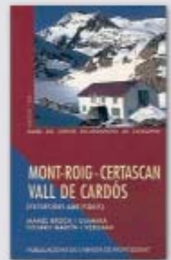
Mont-roig - Certascan - vall de Cardós (Excursions amb esquís)

A la capçalera de la vall Ferrera es troba la població d'Àreu, centre neuràlgic d'una gran part dels itineraris del vessant meridional d'aquesta guia. El refugi de Vallferrera constitueix la base per als principals recorreguts que culminen als cims més destacats de la regió: el Monteixo i la pica d'Estats. Aquesta guia es complementa amb la de la Vall de Cardós (Mont-roig - Certascan), dels mateixos autors.