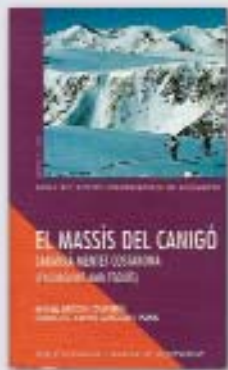
El massís del Canigó. Carançà - Mentet - Costabona (Excursions amb esquís)