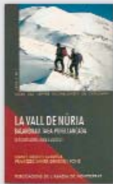
La vall de Núria - Balandrau - Taga - Puigllançada (Excursions amb esquís)

Tots aquests itineraris s'enllacen i es complementen amb els recorreguts descrits a la guia de la vall de Núria, núm. 8 d'aquesta col·lecció i dels mateixos autors.