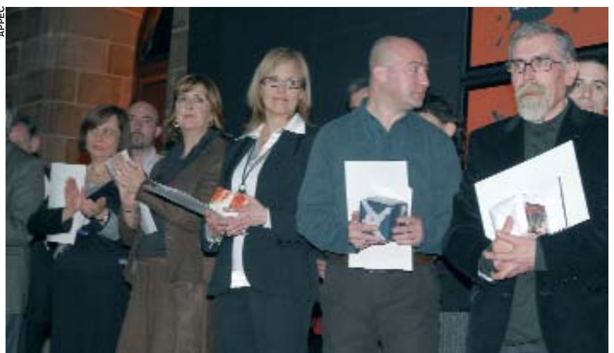
La Nit de les revistes 2008.