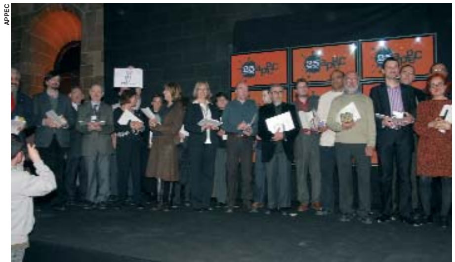
La Nit de les revistes 2008.