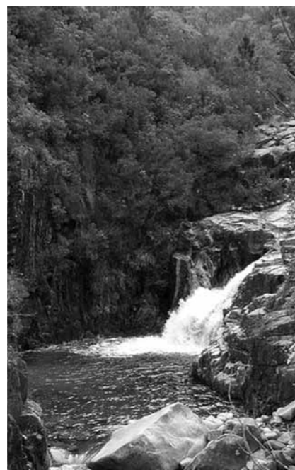
Parc nacional de Peneda-Gerês.