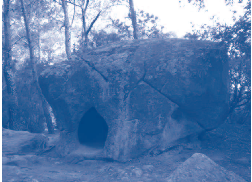
La roca Foradada (dins del terme de Vilanova del Vallès).

Itinerari: Vallvidrera, fonts de la plaça de Vallvidrera, de Can Llevallol i de l'Espinagosa, pantà de Vallvidrera, fonts de la caseta del guarda, de la plaça del Mina Grott, Rosita, Nova, Vella, dels Plàtans, Joana i del Centre Informació del Parc, coll del Gravat,