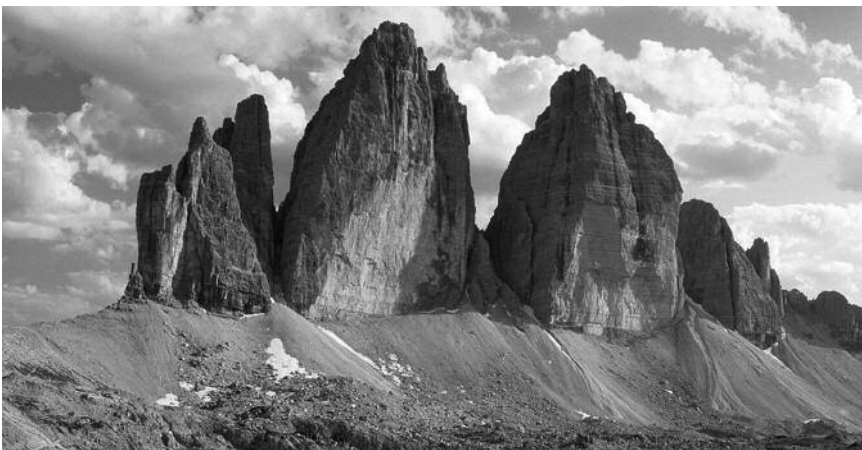
Una fotografia de les Dolomites (vessant italià), projecció i conversa del 10-10-12.