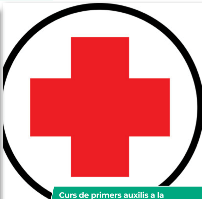
Curs de primers auxilis a la natura Del 3 al 5 d'abril.