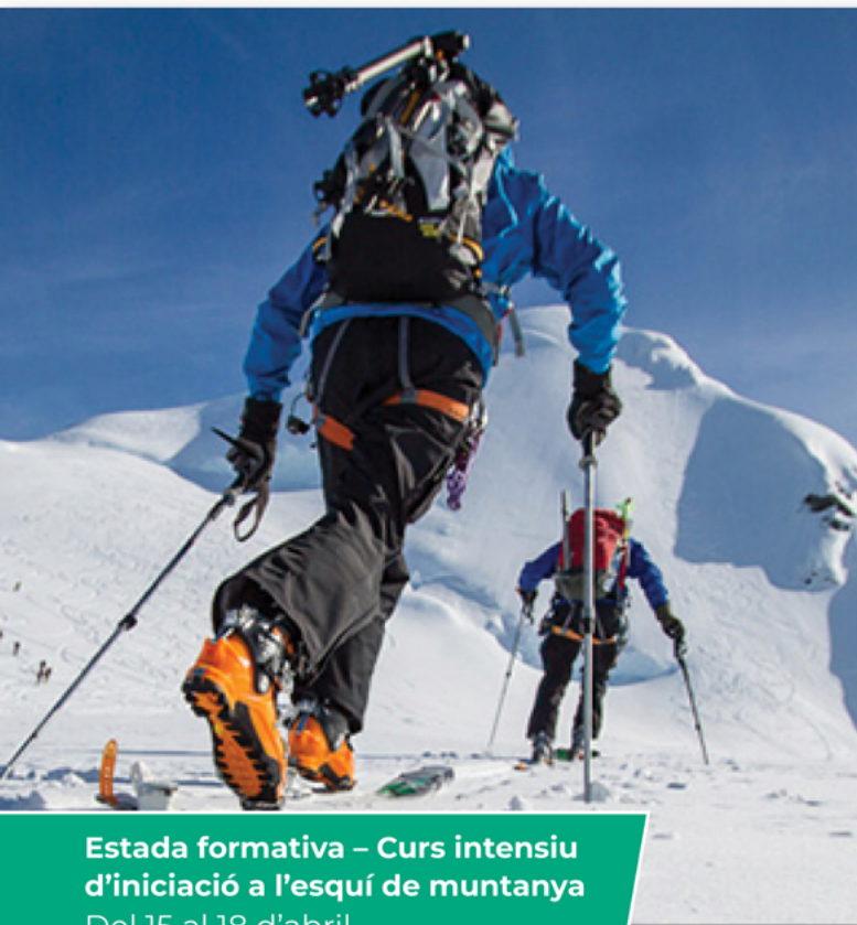
Estada formativa – Curs intensiu d'iniciació a l'esquí de muntanya Del 15 al 18 d'abril.