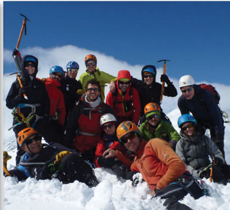
Estada formativa – Curs intensiu d'iniciació a l'alpinisme Del 15 al 18 d'abril.