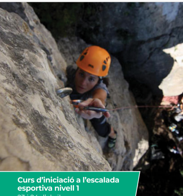
Curs d'iniciació a l'escalada esportiva nivell 1 23 i 24 d'abril.