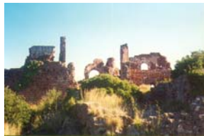
Restes de diverses dependències del recinte sobirà.