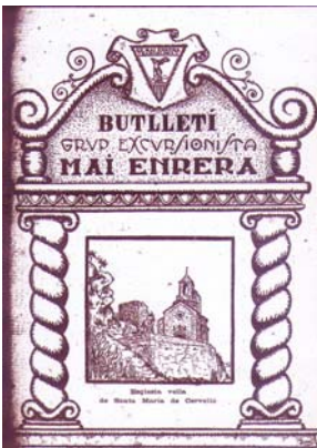
Portada del Primer "Mai Enrera"

La nostra revista és actualment la degana d'aquesta vila ja que va veure la llum el setembre del 1924. En un principi el seu nom era Grup Excursionista Mai Enrera . Va seguir un any després com a Mai Enrera , Butlletí del Club Excursionista de Gràcia .