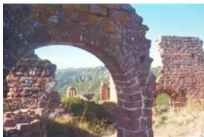
La capella de Sant Miquel del Sijar des del Castell sobirà. Al fons El Garraf.