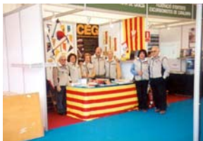
Promocionant el Club. Fotografia de Joan Pascual

nostre fons, vàrem contribuir també a la venda d'una quantitat de llibres cedits en dipòsit per CIM edicions. La presentació dels DVD sobre el Matagalls-Montserrat, Val d'Aran, Cerdanya i Núria va ser ben acollida.