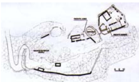
Planta del castell, a partir dels treballs d'en P. Poll i d'en J. Campmany

Situació.- Les restes del castell d'Erampunyà estan emplaçades al cim d'un penyal de gressos vermells a 389 m. d'altitud. Des d'aquest lloc, situat damunt l'èrmita de Bruguers, hom pot admirar un bon panorama: als nostres peus, la platja de Castelldefels fins el massís de Garraf i un bon nombre de pobles de l'industrial i urbanitzat Baix Llobregat; més enllà, el delta del Llobregat, el port i la ciutat de Barcelona; al fons, per un costat, la Serra de l'Ordal i per l'altre, la de Colserola. El castell està dins el terme municipal de Gavà.