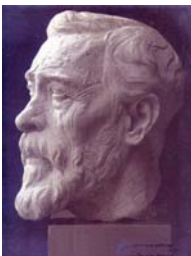
Bust de Francesc Gimeno i Arasa

L'any 1978, ja de ple dins el centenari de la mort del gran pintor, l'Ajuntament de Barcelona, la Junta de Museus, el Museu d'Art Modern i la Caixa de Pensions van decidir d'organitzar-li un homenatge, que, segons el propòsit dels