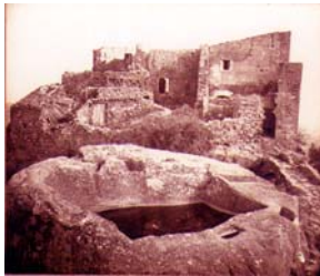
El castell sobirà, amb el pont de pedra - a la dreta - que, fins a mitjà del s. XX en permetia l'accés. En primer terme, la gran cisterna amb algunes tombes antiquesonies.