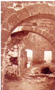
La gran sala, amb les arcades gòtiques, del recinte sobirà. Fotografia de J. Ramon, any 1934. Arxius de Castells del CE-Gràcia, núm. 290

Tot i que al lloc s'hi han trobat no més de 9 o 10 vestigis de l'època iberoromana, el primer document que fa referència al castell d'Erampunyà és de l'any 957. Al segle X aquesta zona compresa entre els rius Llobregat i el Gaià en el límit sud de la Marca Hispànica i, per tant, zona de frontera entre l'Imperi carolingi i els musulmans. Des del castell, situat en un lloc estratègic, es dominava per un costat l'antic