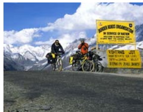
Rohang Pass - 3978m.

La ruta en BTT que ens va explicar l'Àlex transcorre entre les ciutats índies de Leh (3500 m) i Manali (2000 m). Aquesta última ciutat també es coneix amb el nom de Kulantapith, que vol dir "el final del món habitable". Ells tres la van realitzar l'octubre del 2003, encara que els ports de muntanya que es passen, alguns per sobre dels 5000 m, són transitables d'abril a octubre. La distància a recórrer són d'uns 472 km amb un desnivell acumulat de 5000 m. Ells, com que no en tenien prou amb el que els hi esperava i per aclimatar-se més ràpidament, el primer dia van aprofitar per a fer una escapadeta a Khardung La a 5600 m en bicicleta.