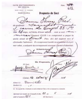
Full d'inscripció de Mossen Jaume Oliveras al Club (1931)