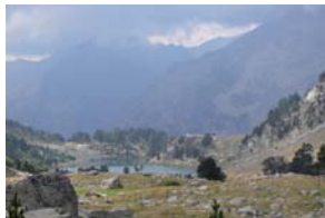
Estany de Bessiberri

Una vegada dalt del cim, destacava sobre tot la imponent silueta del Bessiberri Nord, que es dibuixava abraçada per la boira pel costat de la Vall d'Aran.