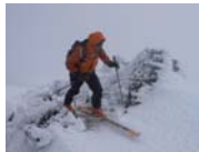
Avançant a contravent camí de l'Antuco.

El vent que sempre bufa a l'Antuco és la major dificultat a l'hora de fer el cim. Pujar-hi ha estat ben bé un regal, no hi c o n f i a v e m . Esplèndides vistes sobre la Laguna Laja. Descens directe i sostingut, una bona esquuada.