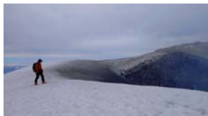
El Joan s'aboca al cràter del Villarrica.

02/09/07 Villarrica (2.847 m) +/- 1.550 m, 5 h l'ascens/1 h el descens, S2/S3 si s'esquia des del cim, orientacions N i NO