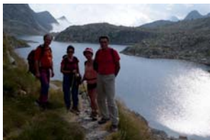
Llac de Rius

Fem nit de bivac a la zona d'esbarjo que hi ha al costat del refugi de Conangles (a uns 500 m de la boca sud del túnel de Viella, refugi guardat), on t'endemà deixem els cotxes i comencem l'excursió (cota 1.555 m). Busquem en aquesta zona les marques del GR-11, i seguim aquest sender que ens conduirà per la vall de Conangles travessant el port de Rius fins al llac de Rius. Voregem el llac tot seguint el GR i abandonem el sender a l'arribar a la capçalera del llac. Llavors prenem un camí que surt cap a la dreta i que ens porta al llac Tort de Rius, un gran llac emplaçat en un racó tranquil i un tant recòndit, allò que tant ens agrada als que estimem la muntanya.