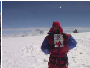
23 hores més tard a dalt del cim del Cho Oyu