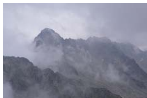
Bessiberri Nord vist des del cim del Tossal del Molar Gran

vida, ja que a l'arribar al coll va ser més gran la sensació de descoberta, ja que ens vam trobar amb l'agradable sorpresa que per l'altre costat, la vall de Bessiberri estava completament despenjada i de sobte vam poder veure el cim enlairat i al nostre abast.