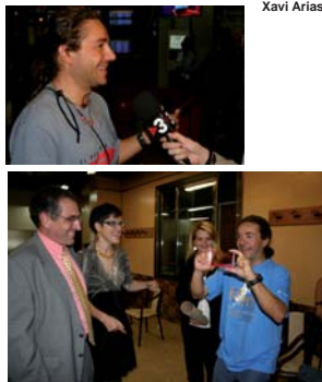
(Fotografies a les contraportades)