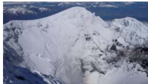
L'impressionant cràter del Llaïma.

És el més alt dels volcans que hem pujat. El seu cràter també és el més profund, té activitat. Si n'hagués de triar només un, seria aquest. Molt de compte en el tram proper a les fumaroles sota el cim. L'escalfor per l'activitat geotèrmica fon la neu en contacte amb el terreny i crea cavitats trampa on es fau calcaure. Cal anar amb quatre ulls! Si es gira boira, cal creuar el pla a 2.000 m pot ser complicat a la tornada.