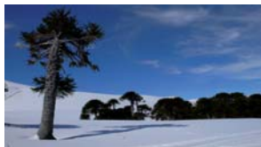
Les magnífiques araucàries de Chile.

La pista d'accés (10 km) pots ser complicada, fins i tot amb un tot terreny, si ha nevat o plugut recentment.