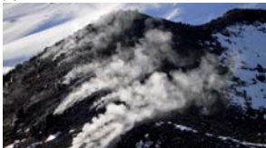
Les fumaroles del Chillán vistes des del cim.

Cap dificultat tret del desnivell. A vegades les màquines de l'estació tenen l'estranya mania de pujar fins a accessos 400 m del cim. L'estació no emet torretes vàlids per una sola pujada.