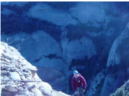
Via ferrada "Teresina" Montserrat

Realització de sortides a diverses vies ferrades amb diferent grau de dificultat depenent de l'experiència dels participants.