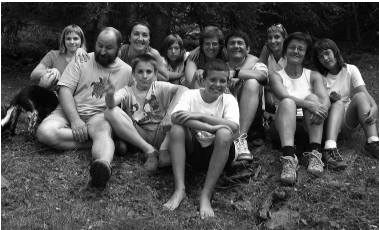
Sortides en família. Participants a l'acampada.

El dissabte dia a 28 de juliol vàrem anar d'acampada a Sant Joan de L'Erm. Ens vàrem instal·lar en un bosc a prop del refugi de la Basseta. Quan vàrem arribar vam plantar les tendes i vam fer una muntanya de pinyes per les barbacoes del sopar. Més tard, ens vam posar a dinar en una esplanada d'herba i, després, mentre els grans descansaven, els petits de la colla jugàvem. Quan els grans ja havien descansat vàrem anar a fer una passejada fins a un petit torrent, on vàrem menjar coca i galetes per berenar. Després, vam desfilir cap al refugi, deixant enrere el torrent, i al cap de 38 minuts ja tornàvem a ser al lloc d'acampada. Quan