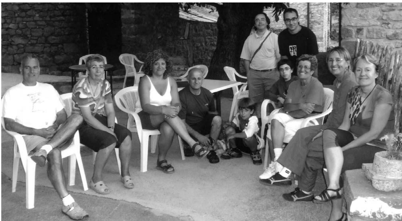
Participants a la sortida al Mont Perdut

No cal que us digui que la sortida va començar a Osona. Després, vam fer ruta cap a Lleida, Barbastro, Ainsa, Escalona i Nerin, poble petit i pintoresc situat a la faldadel Mont Perdut. És obligatori fer l'entrada pel congost/canyó d'Añisclo amb