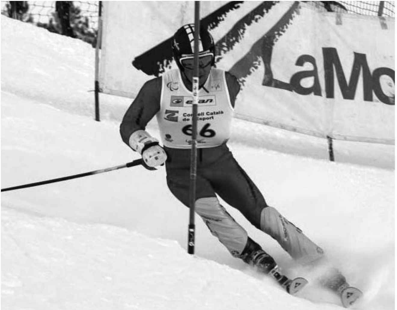
Caminada de la Festa Major

Ja han sortit els calendaris de la Copa d'Europa i de la Copa del Món ( www.asdracing.org ) i ara ens toca reunir-nos i veure, en funció dels calendaris, fins a on podem arribar, ja que sempre hi ha l'aspecte econòmic que pesa molt.