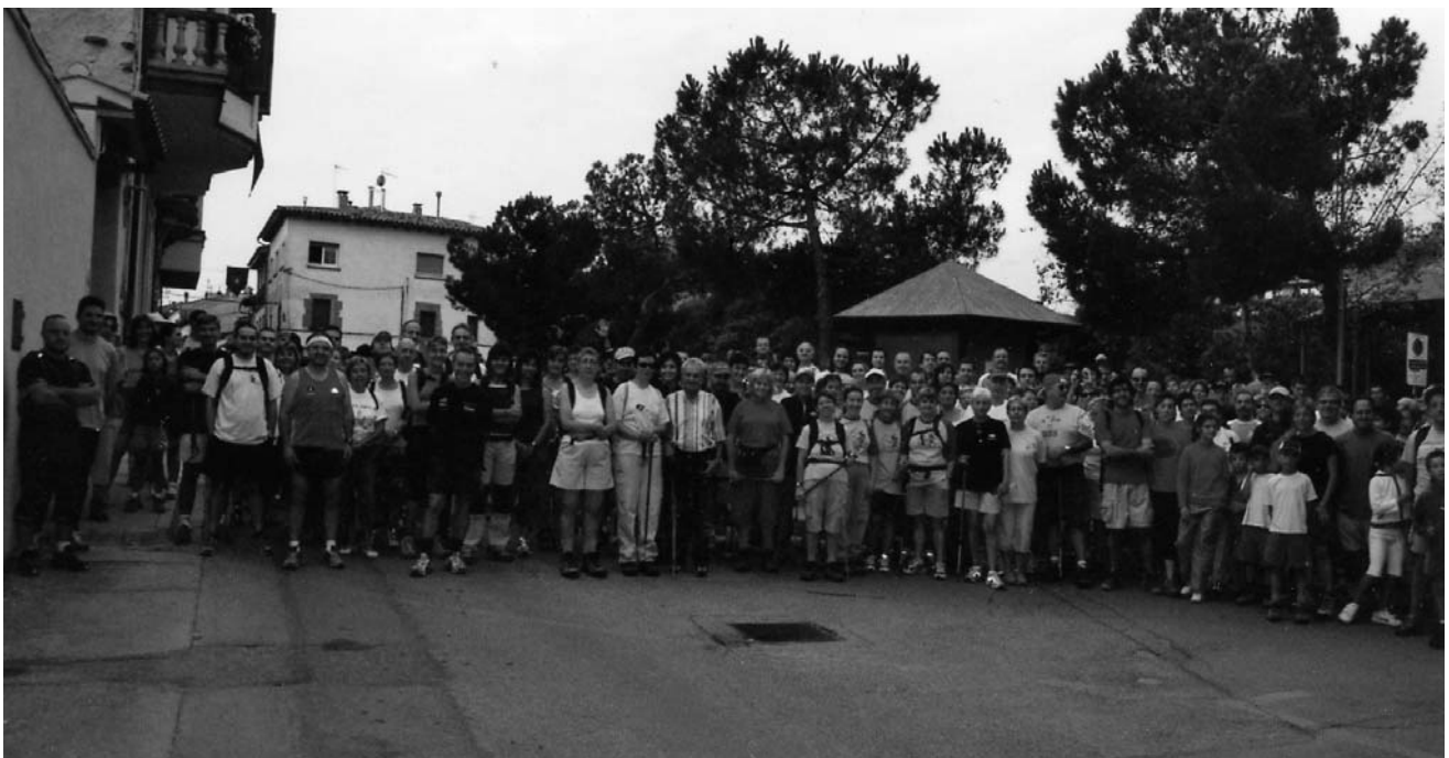
Caminada de la Festa Major

Aquest any la caminada va ser una mica més llarga i el recorregut era nou per a molta gent, fins i tot del poble. A l'hora de plantejar el recorregut, es va propo-