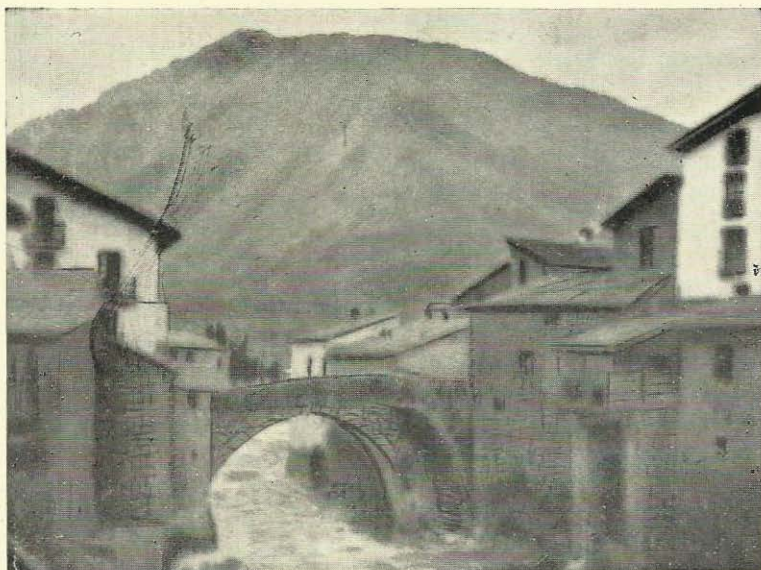
1.º Premi del Saló Local de Fotografies.