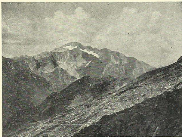
El massiu de Posets (3367 m. alt.) des de la vesant ponentina d'Oo.