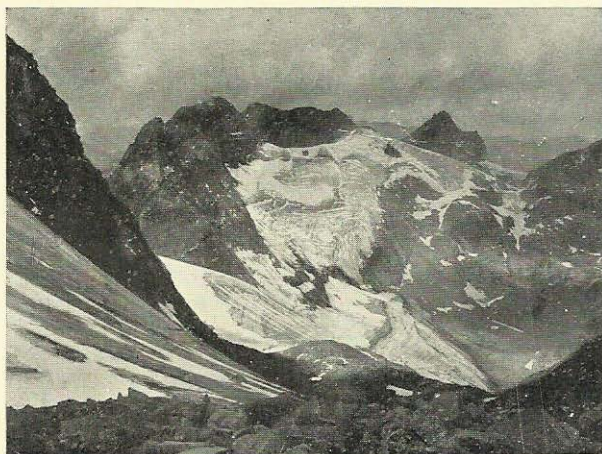
El cercle d'Oo des del coll de Literolla.