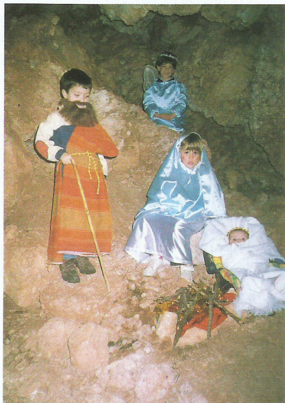
Espeleokinders representant "Els Pastorets" a l'entrada de la cova del Mas Fonoll.