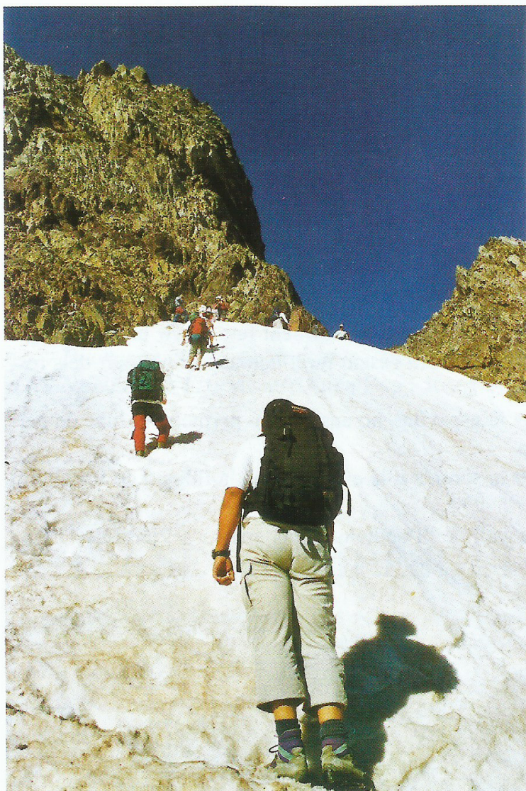
Pujant al coll de Piedrafita.

Després de travessar una gelera i d'una forta pujada, arribem al coll de "Piedrafita", a 2.782 m. Des d'aquí ja veiem els "Infiernos" amb tota la seva majestuositat.