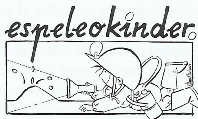
Secció d'Investigacions Subterrànies del Centre Excursionista de Terrassa

— 16 de juliol. COVA D'AIGUA XELLIDA (El Baix Empordà) . Com ja és tradicional en aquest mes, es visità aquesta cova marina i s'aprofità el dia per anar a la platja. La Cova d'Aigua Xellida (anomenada també Cova del Doll) té 80 m de recorregut i una petita platgeta al seu final. El dinar es va fer al conegut dolmen de la Cova d'en Daina.