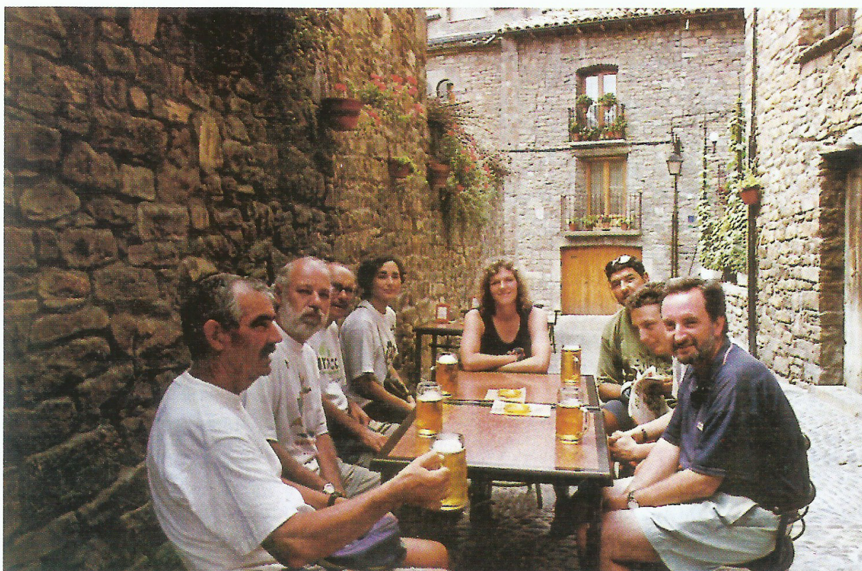
Part dels components de l'excursió a Ainsa.

La seva història comença mab el castell d'origen musulmà amb un petit "burgo" al seu volt. Avui hi veiem la torre de l'homenatge. Durant la Reconquesta d'aquest territori per part dels cristians, va perdre població degut a que la frontera o Marca Hispànica s'anava desplaçant cap al Sud, però la guanyà durant l'Edat Mitjana per la seva importància estratègica en les comunicacions dins del Pirineu Aragonès.