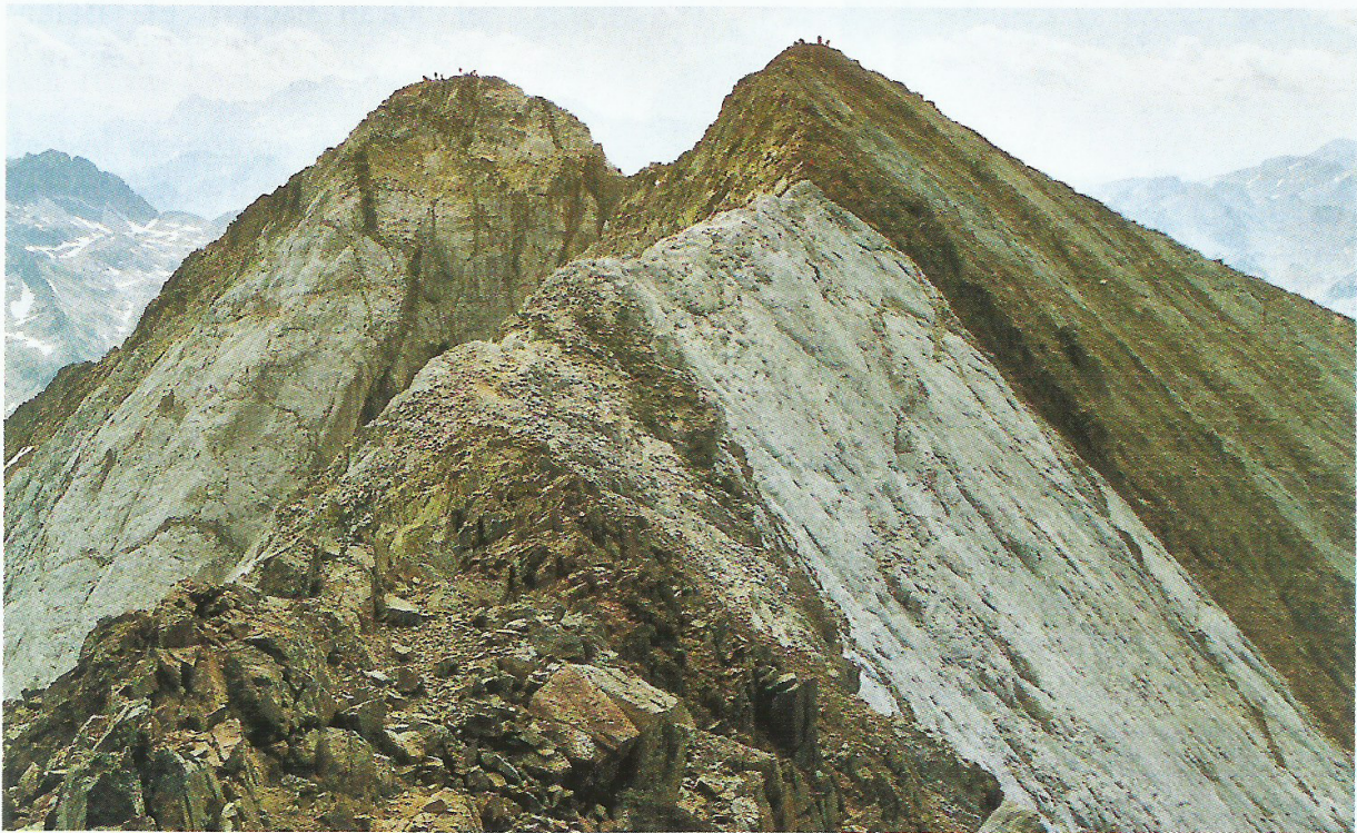
Pics del "Infierno".

Creuem el riu i anem cap a la vall de "Pondielos" fins arribar a l'ibon de "Llena Cantal", sota el pic del mateix nom.