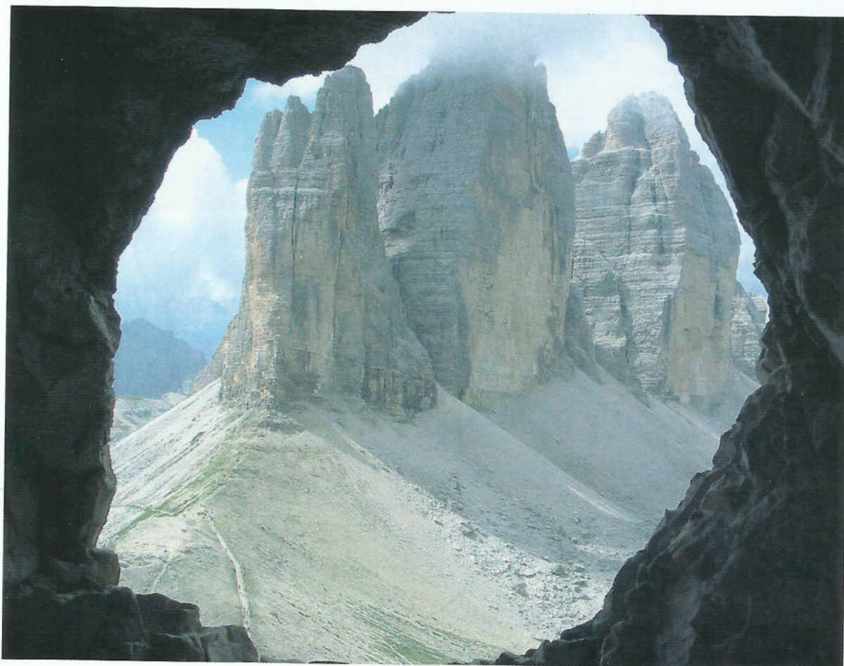
Els Tres Cims de Lacaredo, des d'una de les finestres excavades a la roca.

Recorregut fet per Rosa Serret i Ferran Lozano el 20 d'agost de 2002