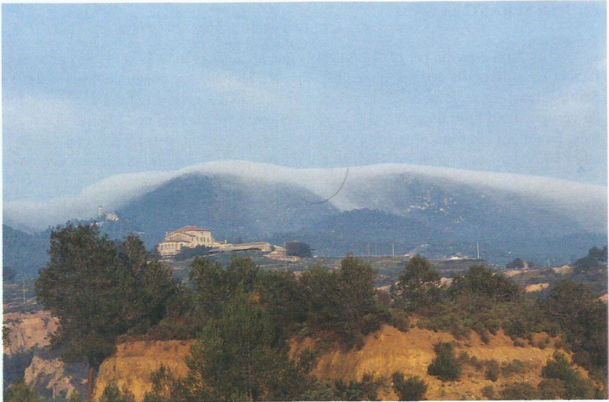
La Serra del Ros superada per la "vacarissana", amb la masia i ermita de can Trias en primer terme.

deguts tant a la importància d'un factor meteorològic com és la boira baixa, com també a la influència dels grans massissos propers de Sant Llorenç del Munt, l'Obac i Montserrat.