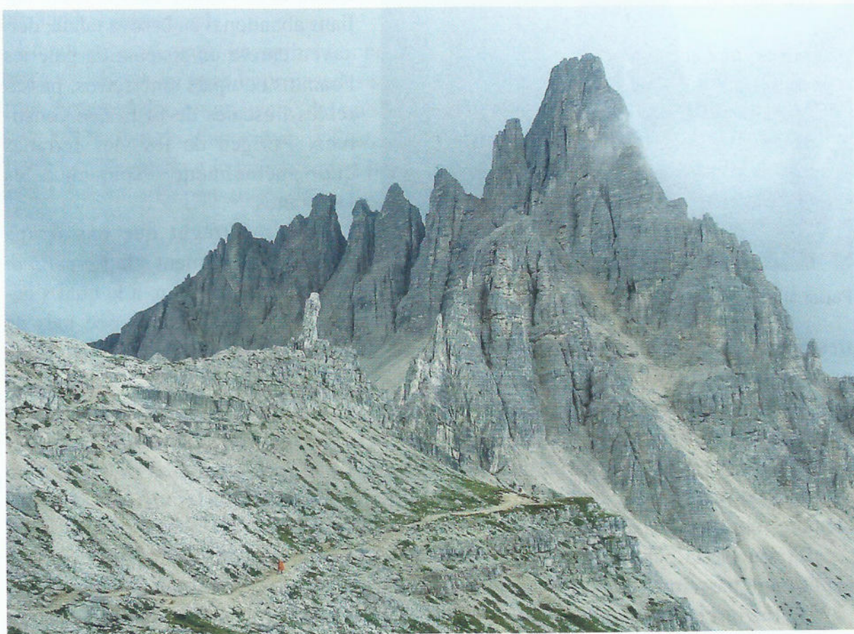
El Monte Paterno, des del refugi Locatelli. En primer pla, la Frankfurter Wurstel.

El 4 de juliol de 1915 moria Sepp Innerkofler, guia de muntanya de Sexten (Sesto per als italians) i cap d'un escamot d' Standschützen tirolesos, abatut per un cop de roc llançat per Pietro de Luca, del batalló dels Alpini de Pieve di Cadore, que havia estat ferit moments abans per una de les granades d'Innerkofler durant l'assalt al cim del Monte Paterno.