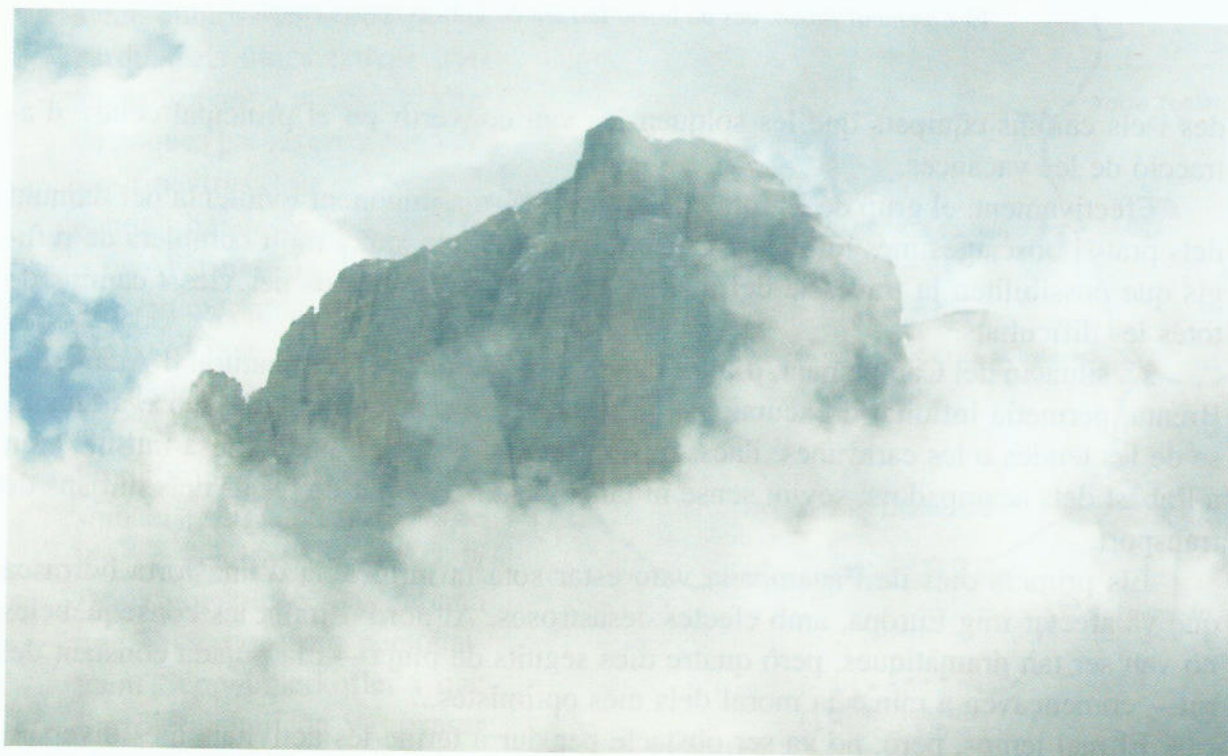
Crozzon di Brenta

Tot i que es van dur a terme activitats muntanyenques a tots dos sectors, l'atractiu inqüestionable de les bigarrades roques dolomítiques i l'espectacularitat de les vies ferra-