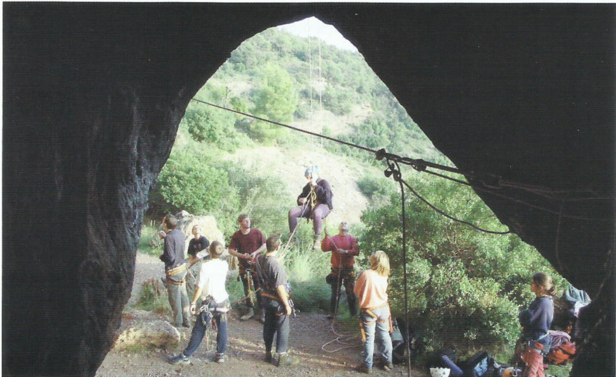
Pràctiques a les Foradades.