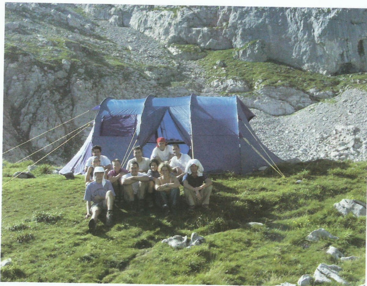
Campament Pics d'Europa.

Localitzada l'any 1986. Segons el treball realitzat en campanyes anteriors, la cavitat finalitza a -14 m amb un tap de neu. Enguany s'ha comprovat que la cavitat segueix en el mateix estat.