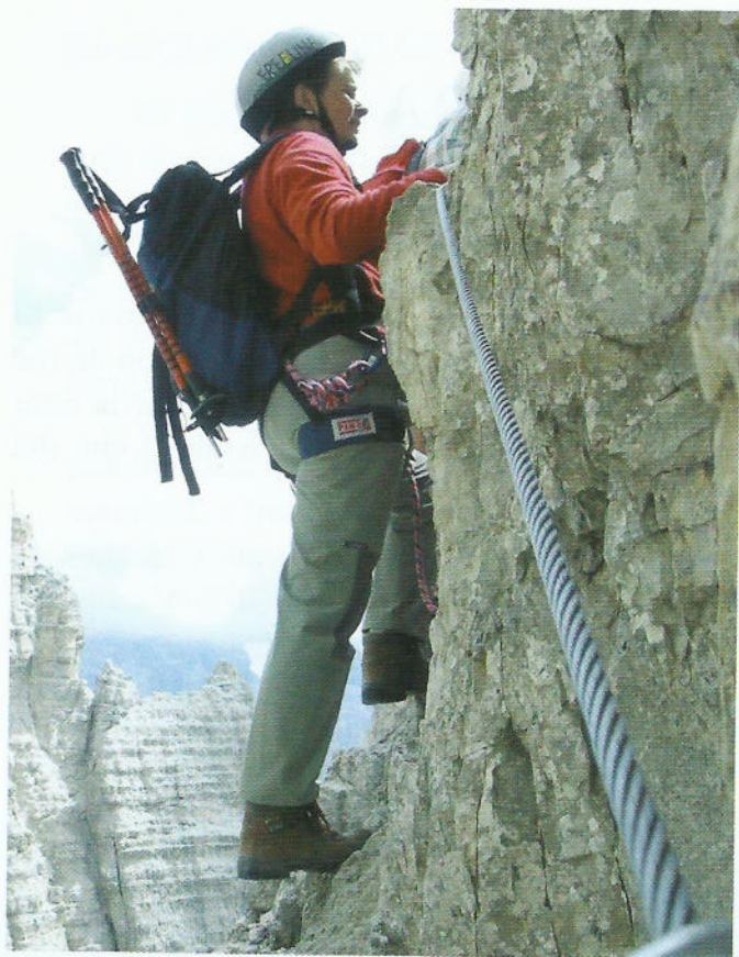
Pujant al Paterno, sobre la Forcella del Camoscio .

Els Tres Cims de Lavaredo presideixen un dels camps de batalla més surrealistes de la història. Tot va començar el 23 de maig de 1915, quan Itàlia va declarar la guerra a Àustria-Hongria i va ocupar militarment el Tirol. Els italians van establir una base d'observació al cim del Paterno, mentre els austríacs controlaven el territori des de la Torre de Toblin, a pocs metres de distància. Quan, al novembre de 1917, els italians abandonaven la seva talaia, deixaven enrere un sistema de galeries i camins equipats amb ferros, passarel·les i escales de fusta que constitueix l'origen de les vies ferrades que actualment solquen les Dolomites.