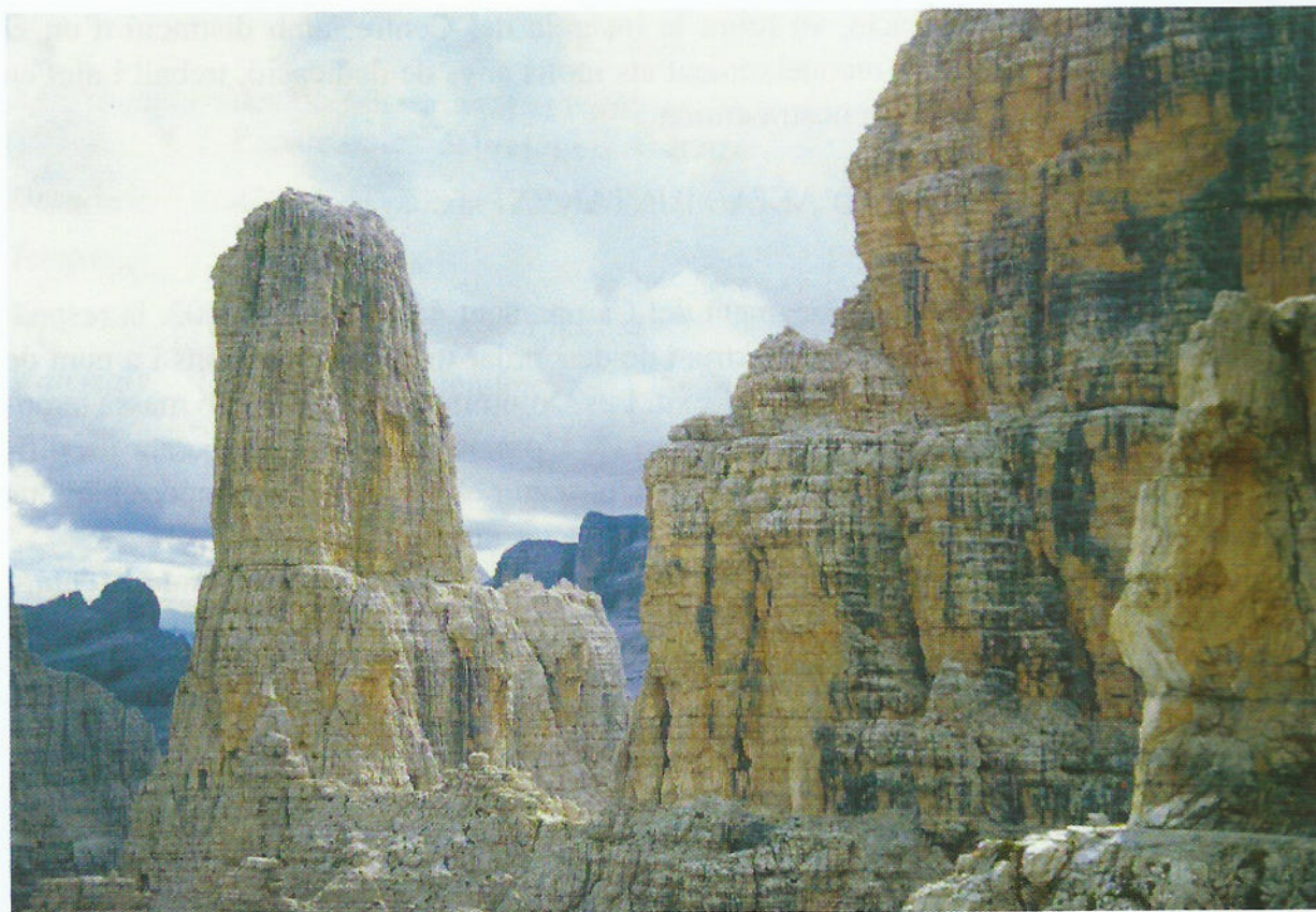
El Campanil Basso , des de la via ferrada de le Bocchette Centrale

des i els camins equipats que les solquen les van convertir en el principal centre d'atracció de les vacances.