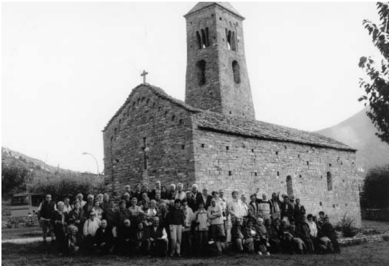
PETITES TRAVESSADES. El grup a Sant Climent de Coll de Nargó. 24-10-04.