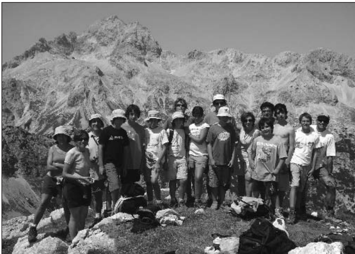
El Triglav al fons, des del Cim del Drazky, de 2.243 m (Campament de vacances 2007)

Correu electrònic: centre@ce-terrassa.org