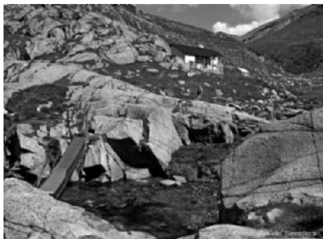
Refugi Coma de Vaca

I és així, immersos en la lectura de la narració de la revolta, com vàrem anar donant cos al projecte de traçar una ruta alternativa al popular camí dels Càtars, més a ponent del territori però paral·lela a aquest, que solca la vessant oriental catalana, a tocar del Mediterrani. També, en contraposició a la noble ruta càtar, la ruta dels nyeros s'identifica amb una classe rural més popular, però que també han deixat la seva empremta ben marcada en la història del nostre territori.