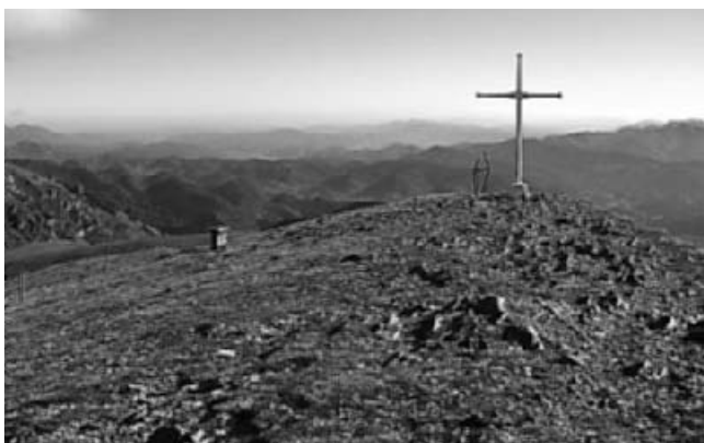
Cim del Taga