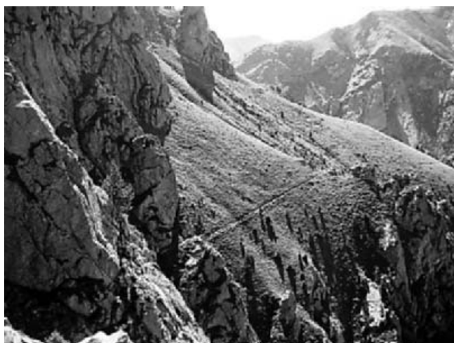
El Camí dels Enginyers

Aquesta excursió és una de les més boniques que es poden fer a la comarca. Des de Queralbs (1.236 m), iniciarem l'ascensió per les Gorges del Freser fins al