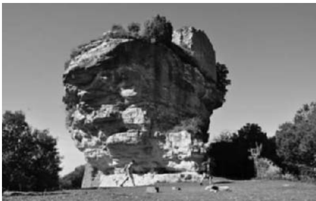
Castell de la "Popa"

Inicialment, nyerro designava qualsevol seguidor o bandoler d'una de les tantes parcialitats locals existents durant el segle XVI a Catalunya, en aquest cas la baronia de Nyer, situada al comtat del Rosselló i pertanyent a la família dels Banyuls. Per extensió, nyerro designava també els vassalls i habitants d'aquesta baronia. Durant els segles posteriors, els nyeros aniran apareixent en l'escenari polític i social revoltant-se contra la imposició castellana, com és el cas de Tomàs de Banyuls i d'Orís, el qual s'enfrontà contra les tropes castellanes durant la Guerra dels Segadors al costat de Pau Claris i de la Generalitat. A partir de la Guerra de Separació, els nyeros (la família Banyuls i els seus seguidors) passaren a col·laborar amb els Angelets de la Terra, un grup de pagesos rossellonesos, encapçalats per Josep de la Trinxeria i en Manuel Descatllar, que s'aixecaren contra la gabella de la sal establerta per l'Administració Francesa durant el segle XVII. La revolta tenia una marcada ideologia política: l'objectiu era alliberar els comtats de la Catalunya Nord del domini francès.