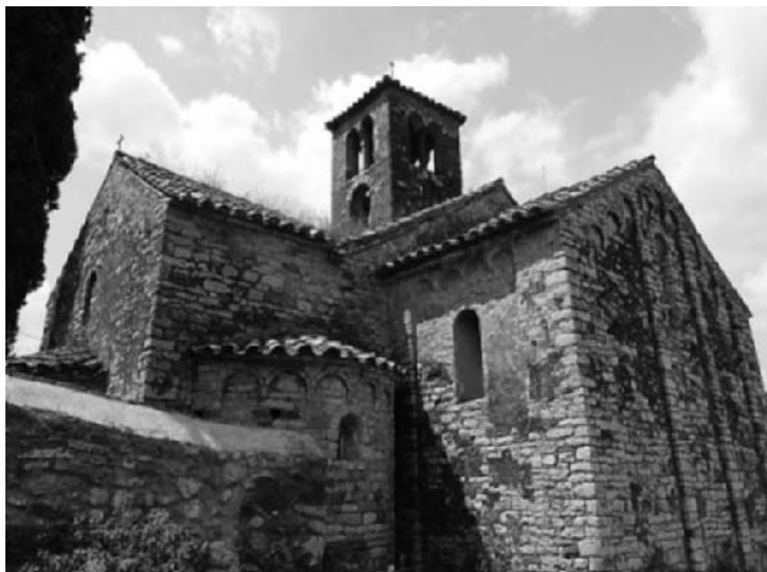
Sant Sebastià de Montmajor

Notes: L'organització es reserva el dret de tancar la inscripció abans de la data