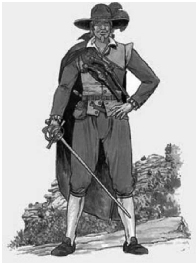
Joan Sala, àlies Serrallonga