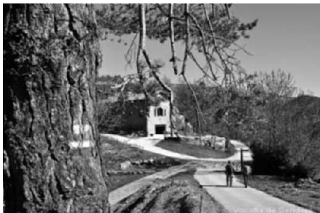
San Joan de les Abadesses