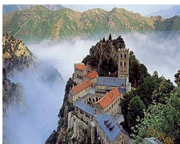
Sant Martí del Canigó

Desplaçament a Prada de Conflent , a la tomba d’en Pompeu Fabra, per encendre la Flama i portar-la a Terrassa.