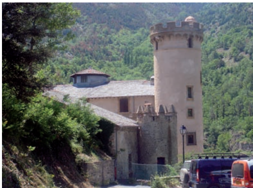
El castell de Nyer