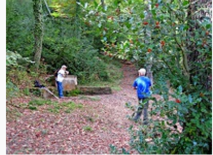
Font de la Sauva Negra

Lloc i hora de sortida: Estació d'autobusos, a les 7 del matí Desplaçament: en autocar Desnivell: 350 metres acumulats Temps de marxa: de 3.30 a 4 hores, aproximadament Recomanacions: calçat adequat, roba d'abric, bastons i capelina. En cas d'amenaça de pluja la riera pot ser que baixi plena; aleshores, és convenient de portar calçat de recanvi i mitjons. Tornada: a la vesprada Pressupost: 30 € els socis i 40 € els no socis, viatge i dinar inclosos Inscripcions: a Secretaria, del 7 al 16 de gener Informació: Màrius Ferrer ( [REDACTED] ) i Rossend Sanllehí ( [REDACTED] ) Propera sortida: 16 de febrer del 2014, litoral tarraconense És obligatori que els caminadors estiguin federats, o bé que es federin per un dia ( 4,80 €).