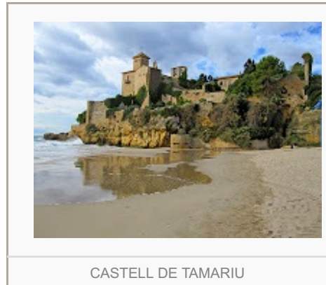
CASTELL DE TAMARIU

Un cop tips, continuarem caminant per la llarga platja d'Altafulla a la desembocadura del riu Gaià. Passarem per davant del càmping Tamarit, tot trepitjant la sorra, pujarem pel costat del castell de Tamarit, del qual només podrem fer fotos, ja que és una propietat privada i no la deixen visitar, però això ens farà arribar al capdamunt dels penya-segats, des d'on podrem gaudir d'unes vistes fantàstiques, i acabar en una petita cala en estat salvatge. Pujarem per un petit camí que s'endinsa pel bosc a una pista que, seguint els penya-segats i el bosc, ens condueix a la platja de Torre de la Mora. Fins a aquest punt hauréu recorregut uns sis quilòmetres.