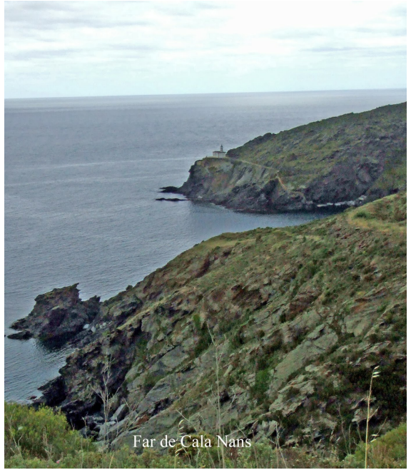
Far de Cala Nans