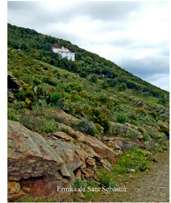
Ermita de Sant Sebastià

Novament aquest any hem preparat una sortida pels voltants de Cadaqués. Els caminadors sortirem de baix l'aparcament del poble i tot seguit seguirem la platja Gran en direcció sud. Arribarem a Port Doguer i a la platja d'es Llané on resta dissimulat un monument a Garcia Lorca. Al front mateix agafarem un camí bastant costerut fins arribar a l'ermita de Sant Sebastià. Val la pena pujar fins a dalt d'aquesta església per la vista impressionant ( si fa un dia clar ) del seu paisatge. Cada 20 de Gener, festa de Sant Sebastià els cadaquens celebren una trobada a l'ermita que esta situada a sota mateix del puig Pení. Ells i forasters canten els goigs del sant i les " patacades ". Unes cançons populars de contingut irònic i que malauradament amb la falta de gent gran es van perdent.. També la gent fan arrossos i passant el dia al camp amb família. L'Església la resta de l'any està tancada al públic ja que es de propietat privada.