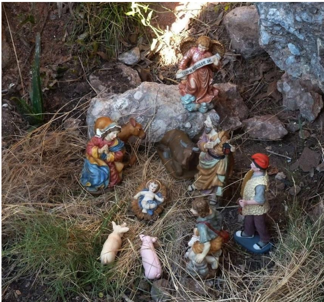
Pessebre de l'any 2015, al camí de les Bateries