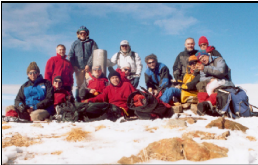
El Grup de Muntanya al Pic del Salòria (2.870 m) el passat 22-23 de gener