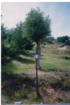
Terreny La Molina