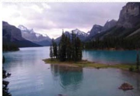
Llac Maligne →

Mes avall trobem el Llac Medicine (una de les més importants reserves d'aigua subterraneas d'Amèrica del Nord). Els indis li van posar aquest nom donat que en el més d'octubre queda totalment sec i no es torna a omplir fins a la