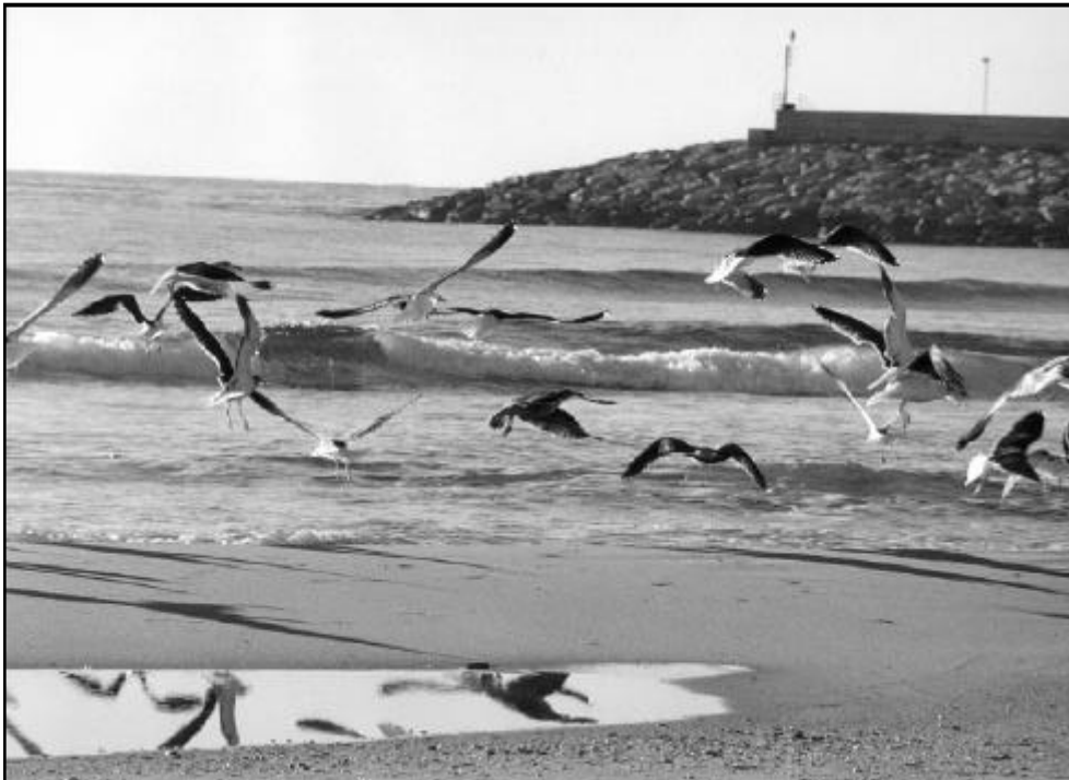
Una de les fotografies de la millor col·lecció «Miralls», de Maria Cònsul