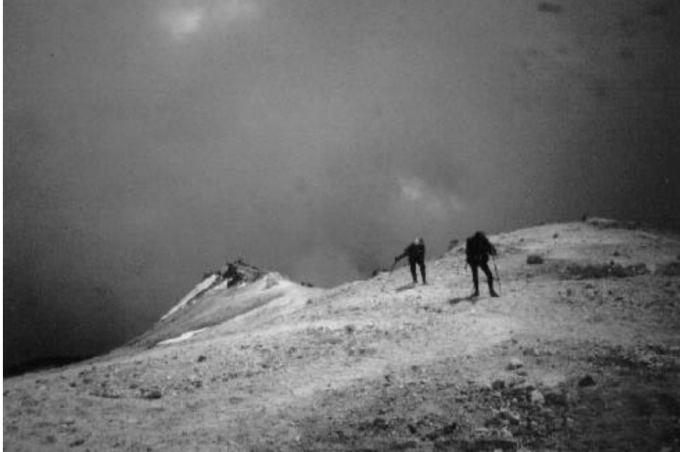
Darrers metres abans del cim a 5.400

plantem gairebé a 5.000 m. Ningú hi havia pensat, però de seguida algú diu " Ens queden només 700 m i hem de tornar a baixar... i demà una altra vegada aquesta tartera? Què hi farem! això vol dir aclimatar-se. Havíem arribat gairebé a tocar la neu. Però cap avall i a descansar.