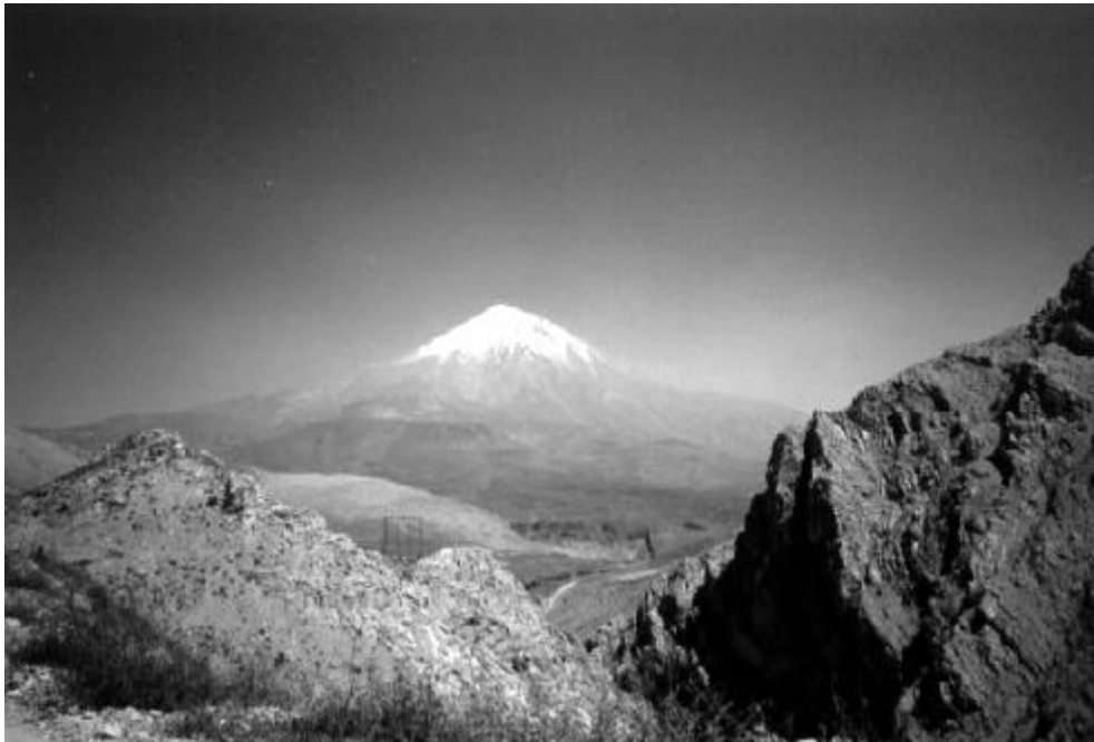
Vista del Damavand, camí de Gosfandsara

Després d'escollir la cara sud, com a opció més adequada, vàrem iniciar l'ascens al campament de Gostandsara a 2.900 m. En aquest