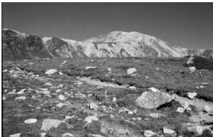
La GR-11 segueix el camí que va del refugi d'Ulldeter al Coll de la Marrana. Al fons s'alça majestuós el Bastimente.

els punts de proveïment i de descans, les dificultats del camí i el terreny, els paisatges i les coses que li poden ser amenes, sense la rigidesa d'horaris. Una aventura plàcida de descoberta d'un país inèdit, la llibertat de la natura a ple aire. Valls i rius, muntanyes, boscos, prats i cultius nous per ell, una vegetació des d'alpina a semidesèrtica. Una sorpresa a cada revolt del camí, un monument a cada poble –si és que no ho és tot ell–. Això és fàcil, per poca preparació física que hom tingui; només cal una mica de coratge i ser prudent amb si mateix. Aquests camins són traçats per tal que puguin ser recorreguts per tota classe de persones: adults i infants, en grups d'amics, de familiars o en solitari, cosa no recomanable si no teniu un esperit fort o vulgueu trobar un gaudi espiritual, com en Jean-Jacques Rousseau el promener solitaire .