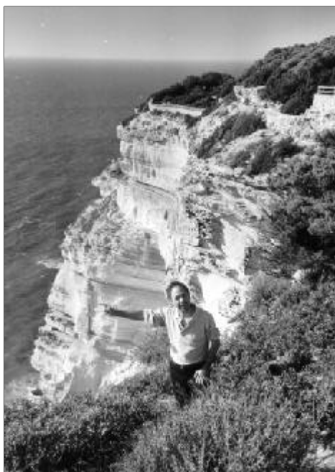
"El Tajo" de Barbate

El camí comença vorejant la platja; després ens endinsem per una dreuera de sorra enmig d'una extensa pineda plantada a primers de segle per mantenir les dunes al seu lloc. Durant la travessa per la pineda se'ns ofereix la possibilitat d'anar ascendint fins a la Torre del Tajo i