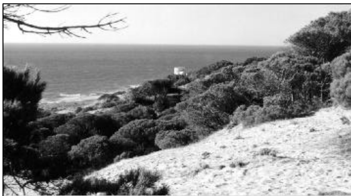
Pineda i torre de "El Tajo"

Més tard ens vam dirigir al cap de Trafalgar (recordem que l'any 1805 a Trafalgar va tenir lloc la desfeta de les armades espanyoles i franceses per part dels anglesos comandats per l'almirall Nelson). Aquesta costa té molta història i ara també ocupa portades als diaris, tertúlies a la ràdio i reportatges a la televisió a causa de la immigració clandestina. A les platges dels voltants es poden veure esportistes practicant el windsurf i el surf amb parapent perquè els vents hi són favorables. Al cap de Trafalgar hi ha un far on ens vàrem aturar per contemplar la posta de sol: espectacle magnífic que esdevenia exactament a les 18,10 hores.