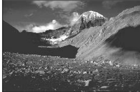
Vessant est del Kailas

La circumvalació –o khora en tibetà– al Kailas comença en el petit poble de Darchen (4.560 m.). És un trajecte de 53 km. i es fa en el sentit de les agulles del rellotge. Es triguen tres dies a fer aquest recorregut a causa del cansament produït per l'enrarament de l'aire, perquè en aquesta alçada la pressió de l'aire és aproximadament la meitat de la que hi ha a nivell del mar. La segona jornada és la més feixuga, però alhora és la més esplèndida; en el tram final fins al pas de Dolma La (5.670 m.), el