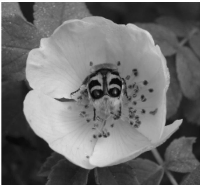
Millor fotografia per votació popular: «Posseïda», de Jordi Gironès.