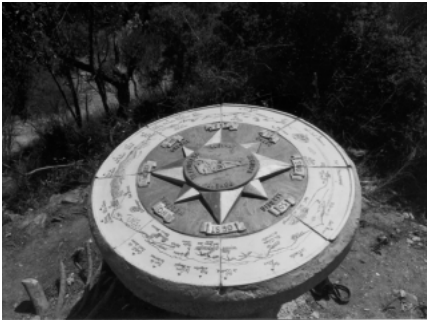
Rosa dels vents de ceràmica col·locada al cim de la Peña del Moro l'any 1981