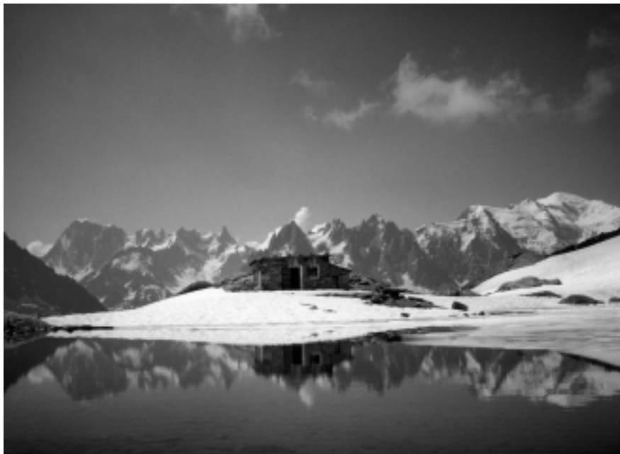
Una de les fotografies de la millor col·lecció: «Llacs», de Jordi de la Riva.