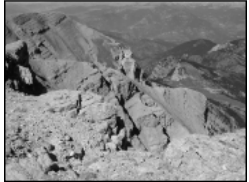
Paret nord del Cadí des del Comabona.

Des de Terrers al coll de les Bassotes haurem emprat una hora i