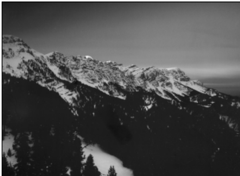
Millor fotografia: «Cadí», de Joan Portes.

Els patrocinadors que han fet possible aquesta edició han estat: Ajuntament de Sant Just, "La Caixa", Finques Amat, Recallwis Buser i la Unió de Botiguers,