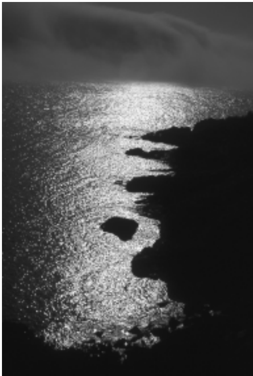
Millor fotografia feta en les excursions de la SEAS: «Negre i argent», de Ferran de la Fuente.