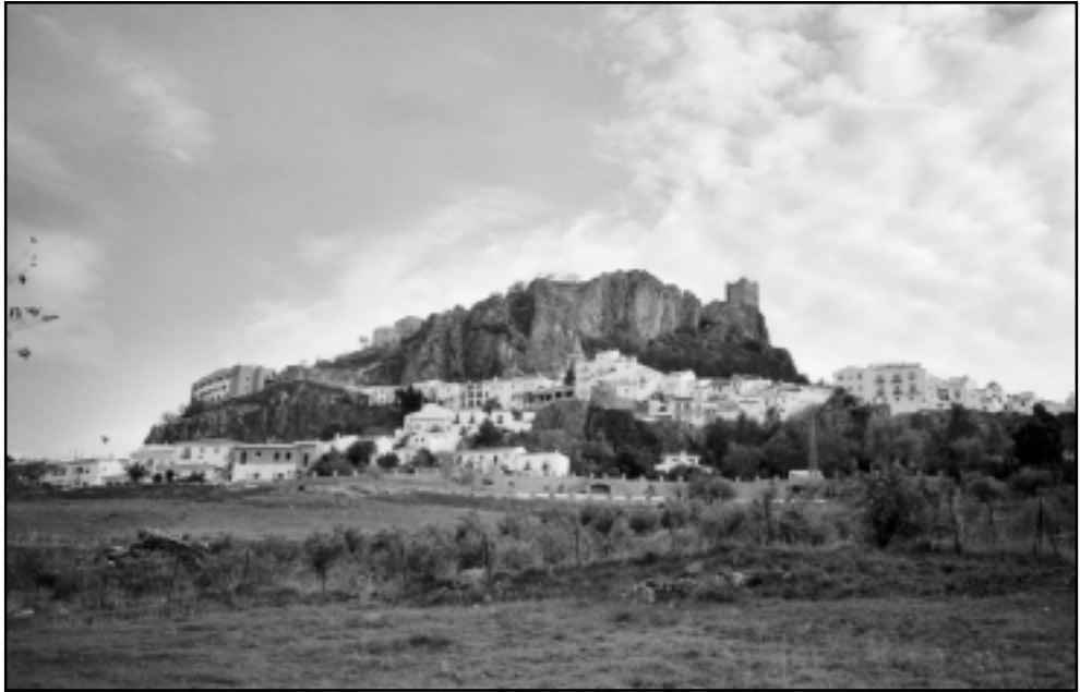
Zahara de la Sierra.

part existeixen moltes ofertes turístiques recreatives i esportives: senderisme, educació ambiental, escalada, espeleologia, piragüisme, baixada de barrancs, puenting, parapent, ala delta, rutes amb bicicleta i a cavall, orientació en la natura, pesca, observació d'aus, etc.