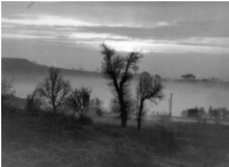
Fotografia més original: «Arbres», de Joan Fernàndez.