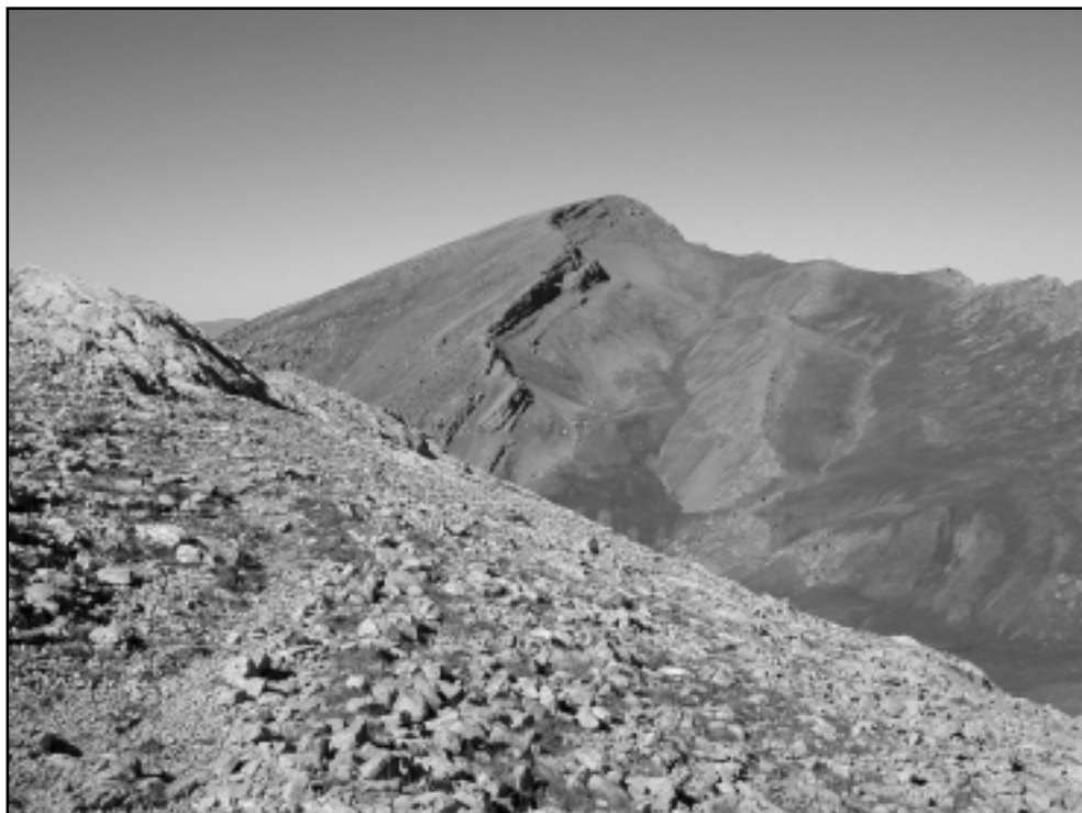
Costa Cabrolera des de la serra Pedregosa.

Coll de les Bassotes – Pont de Cernerres: 1.05 - 6.00 h.