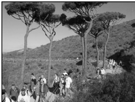
Caminada Popular 2003.

Una bona part de l'èxit de la Caminada creiem que es deu al fet que cadascun dels participants en l'organització ha assumit el seu paper i responsabilitat dins de la Caminada i coneix el que ha de fer a la perfecció. A més de la paperassa (impresos, mapes, permisos, comunicats a autoritats i entitats implicades i contactes amb col·laboradors) i la selecció de l'itinerari, que des de mesos abans s'han anat enllestint; cal preparar cinc-cents entrepans en una hora, inscriure més de tres-cents participants en poc més de trenta minuts en el lloc de la sortida, senyalitzar el carrer i tot l'itinerari en menys d'una hora, distribuir els entrepans, begudes, postres i cafè als participants, recollir les deixalles i deixar la muntanya i el recorregut totalment net quan ja està entrant l'últim participant a l'arribada. Tot això diu molt de l'efectivitat dels companys que es dediquen desinteressadament a aquestes feines.