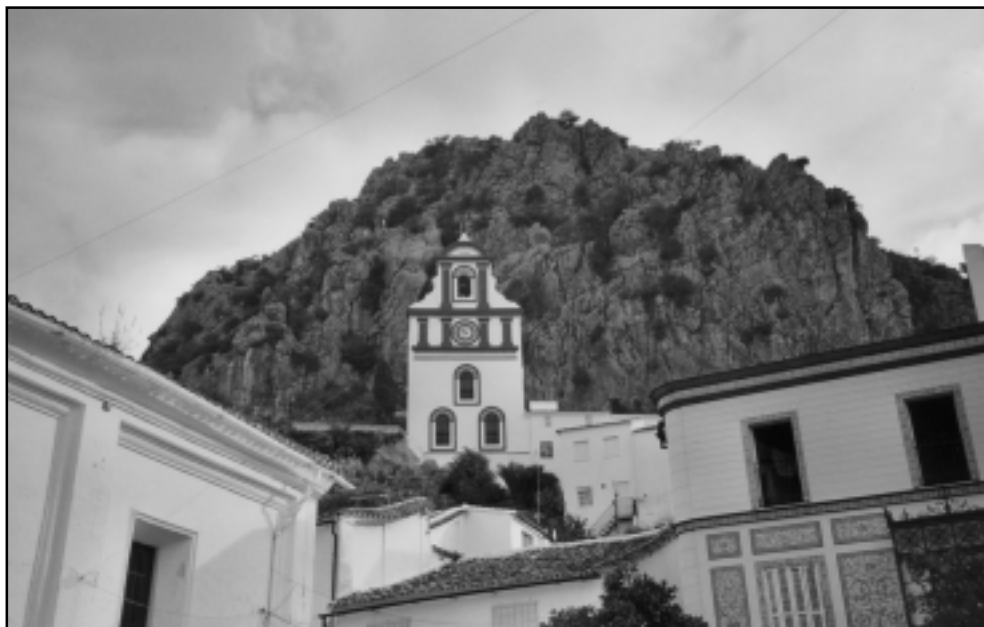
Poble d'Ubrique.

El camí de los Llanos de Ravel comença en una pista que s'endinsa en el bosc; aquesta pista està tancada i només hi poden passar les persones encarregades de la conservació del parc i els treballadors de l'empresa EGMASA que cuiden el bosc. La vegetació de la zona és abundant i està constituïda principalment per alzines i roures ( quejigos ); més endavant ja es comencen a veure pinsaps aïllats, i més amunt es troba el frondós bosc de pinsaps, el pinsapar . El pinsap ( Abies pinsapo ) pertany a la família de les pinàcies;